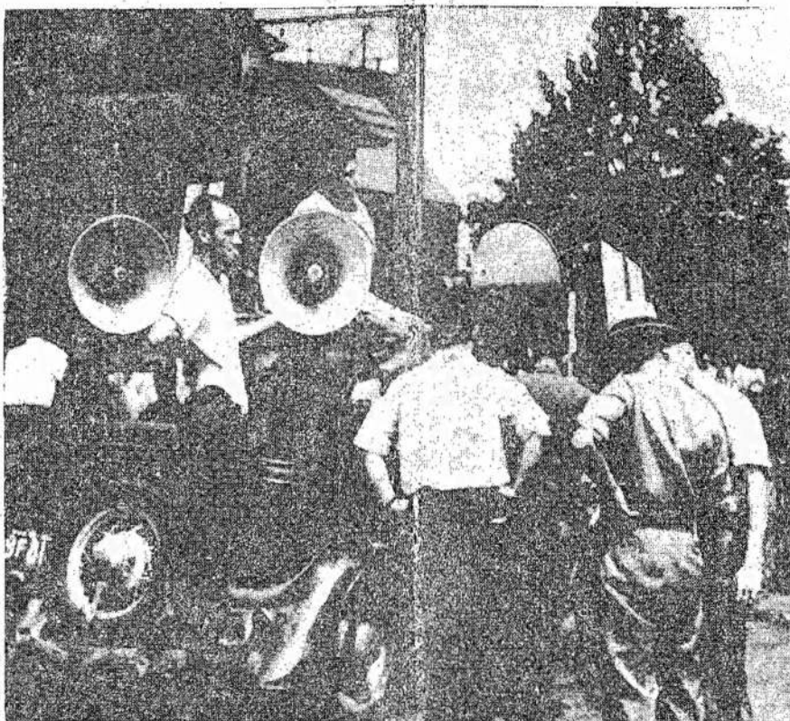
Pieno darbininkai Hamiltone informuojami apie streiko eiga per didelius garsia-

Pereitą mėnesį jo knyga "Prailginimas Gyvenimo" buvo išleista Jungtinėse Valstijose.