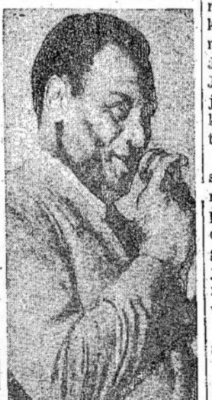
Paul Robeson, garsusis negrų dainininkas, kuris aną dieną kalbėjo ir dainavo streikierių mitinge Windsor. Jis pareiškė, kad jis visuomet bus su tais, kurie siekia geresnio gyvenimo darbo žmoniems.