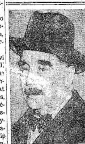
H. G. Well, pasauliniai pargarsėjęs britų rašytojas-istorikas, kuris mirė perėta savaitę, sulaukęs 79 metų amžiaus. Plačiausiai žinoma jo knyga yra "Pasaulio Istorija".

Pasauliui reikia taikos. Be taikos, be gražaus gyvenimo, tautos gali susinaikinti ir be atominių bombų. Klausimas lieka, kaip palaikyti taiką.