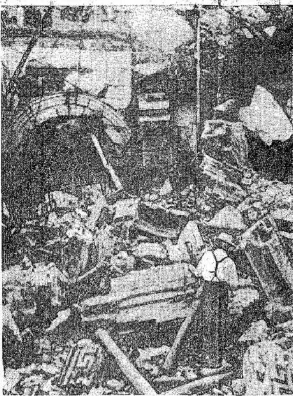
Zemės drebėjimas Dominikano respublikoj pridarė nemažai nuostolių, bet daugiausiai nukentėjo bažnyčia Moca miestelyje. Ji subyrėjo, kaip puodas. Žmonių žuvo tik 52, bet visa eilė miestelių turės būti atstatyti.