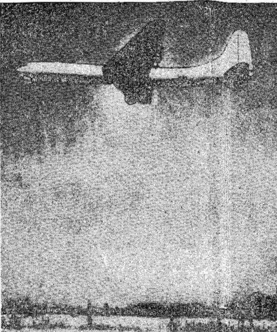
Naujas Jungtinių Valstijų orlaivis B-36. Šis orlaivis yra tikrai milžinas. B-29 prieš jį yra tiktai vaikas. Jo uodegos skiauteris yra 6 pėdų aukščiau. Ratai aukštesni už žmogų. Tai karinis orlaivis, nors karas jau užsibaigė.

Si imperialistinė politika sudaro taktai didžiausią pavojų. — Vilnius.