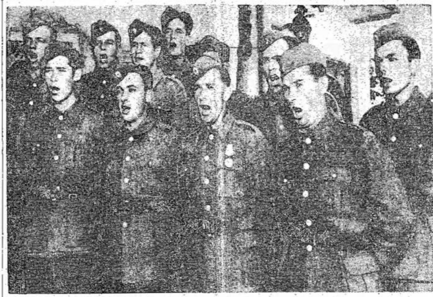
Jau ni jugoslaviai kareiviai traukia savo tautos dainą. Jie pasirengę ginti savo

MANILA. — Jose P. Laurel, kuris laike japonų okupacijos buvo Filipinų valdžios galva, paliuosuotas iš kalėjimo.