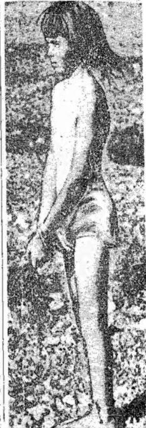
Medžiotojai surado Sirijoje vaikutį "Tarzaną". Gydytojai dabar jį tyrinėja. Sakoma, kad jis gali išduoti tik tokius balsus, kokių išduoda gyvuliai. Jis buvo toks greitas, kad pralenkė džypus.

Žiūrovas, neturėjęs laimės patekti į Mažąjį teatrą, gali svajoti patekti į Dailės teatrą, į Mchatą, kuris taip pat randasi netoliese, tačiau atsižvelgiant į tai, kad Mchatas laikomas pirmuoju teatru pasaulyje, ne daug vilčių teduotume atkakliam laimės ieškotojui. Nedrįstume, betgi, atimti jam tąją viltį visiškai: Maskvoj bilietai parduodami poriniais, po du, tad gali juk įvykti, kad partneris ar partnerė nesugeba ateiti. Tačiau tolygiai galima surasti dobielienoje puodą su auksiniais daiktais, pasitaiko juk ir šitokių atsitikimų! — Nepatekęs operon Didžiojo Teatro gerbėjas gal