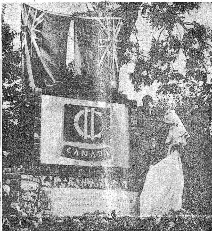
Kanados premjeras Mackenzie King atidengia paminklą Poureville'j, Francijoj, tiems kanadiečiams, kurie krito laike puolimo ant Dieppe. Užpuolimas ant Dieppe buvo pirmas bandymas veržtis į Franciją. Krito daug kanadiečių, bet jų kova davė daug pamokų dėl būsimo invazijos. Jie užsitarnavo pagarbą.

Kompanijos nenori pasirašyti taip vadinamos "closed shop" sutarties, nors kitos yra pasirašius.