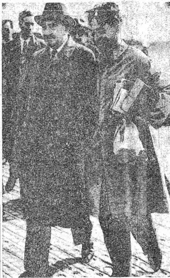
Dr. Chaim Weizmann, Zionism judėjimo galva, atvyko į Londoną, kur norima išspręsti Palestinos problemą. Bri-

Safety Deposit Boxes at all Our Offices BRANCHES IN ALL PARTS OF THE CITY