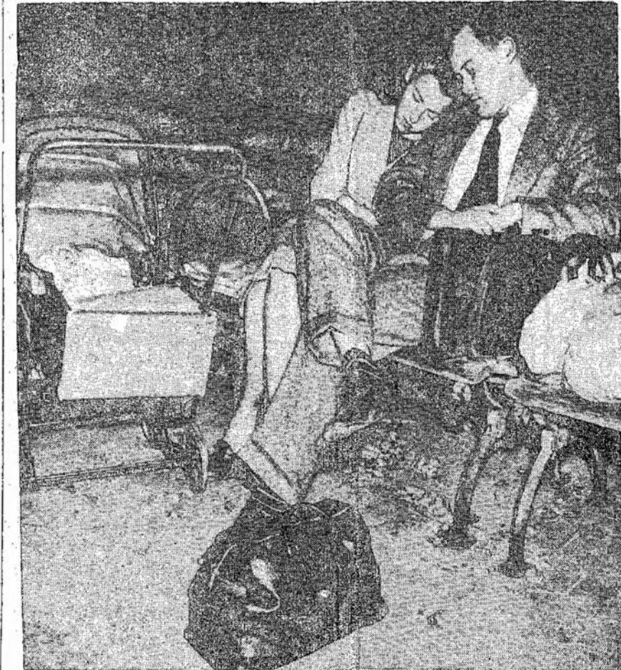
Butų stoka pasireiškia ir neturi buto. Vyras ieško dar-turtingoj Amerikoj. Stai kučiu "ilsisi" parke, kadangi bo, o moteris buto.