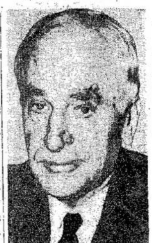
Cordell Hull, buvęs geras Roosevelto draugas ir tarnavęs jo valdžioje už valstybės sekretorių. Jis sunkiai ser-ga.

Liudies Balse No. 781 bu-vo padaryta klaida skelbiant aukas dėl Dotnuvos Zemės