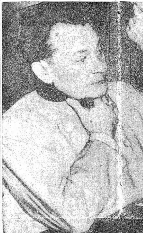
Herman Goering, antra Hitlerio ranka, apsukęs skepetaite kaklą bando patirti, kaip bus, kada ji kars. Jis ir 11 kitų nacių vadų bus pakarti ne vėliau šio mėnesio 16 dienos. Jie jau mato, kad "crime does not pay."

Pienas pabrango todėl, kad federalė valdžia nustojo mokėti subsidijas pieno pristatytoms fermeriams.