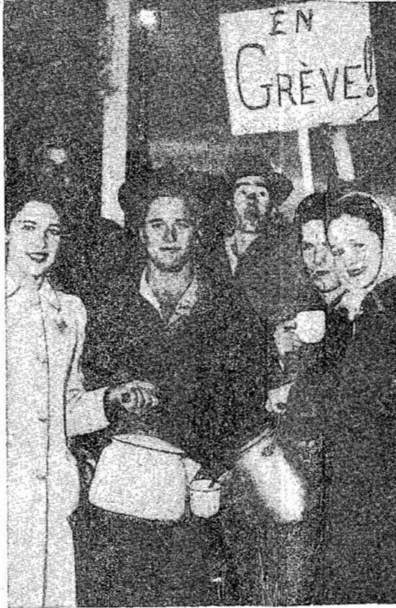
Niekam nėra taip skani kava, kaip streikieriams ant pikieto linijos, ypač miško darbininkų streike. Čia matote timmsinietę vaišinant pikietininkus šilta kava. Unija aprūpina pikietininkus kava ir užkandžiais.