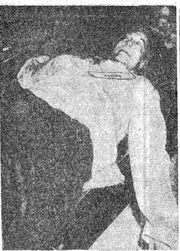
Hermann Goering kartą sa- kė, kad nei vienas sąjungini- ninkų orlaivis nepasirodys virš Vokietijos. Buvo visai kitaip. Ant galo jam pačiam grumojo kilpa ant kaklo. Bet pas jį nebuvo drąsos stoti prieš teisybę vykdytojus ir mirti už načių tikslą. Jis nu- sinuodėjo kaip koks bailsys. Čia jis matomas po nusiuo- dyjimo.