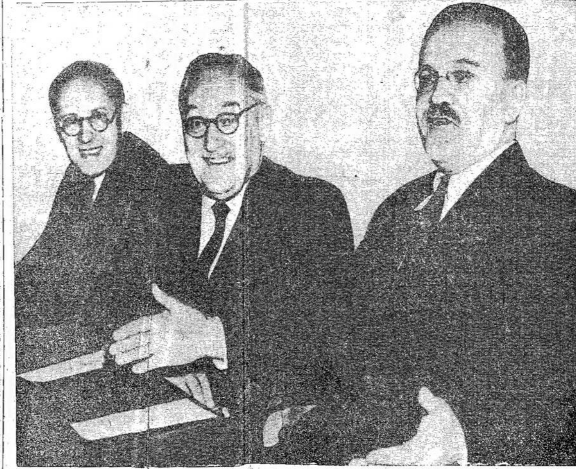
Pirmaeiliai Sovietų Sąjungos diplomatai: Novikov, SSRS ambasadorius, A. Y. Višins

Progressyvų lietuvių vaikai didelėje didžiumoje yra labai puikiai užauginti. Seimose ramybė, susitarimas, nėra didelių kasdieninių ginčų, to (Nukelta ant 5 pusl.)