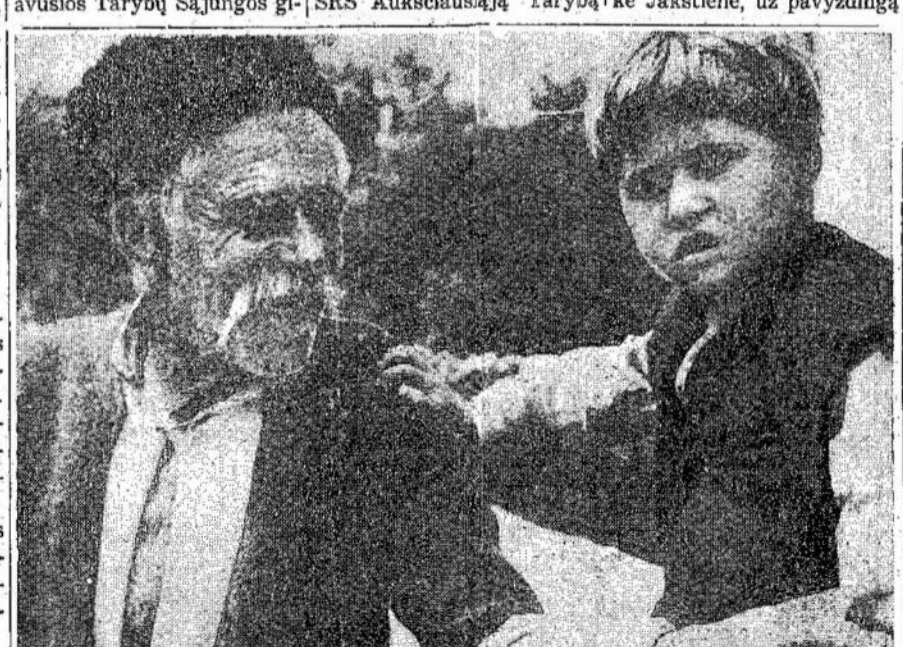
Bulgarijos valstietis su savo anūku patenkinti, kad rinkimus laimėjo Tėvynės Frontas, kuris stovi už išdalinimą žemės valstiečiams. Tėvynės Frontas, sudarytas iš kairėnių partijų, gavo didžiulį vietų ir sudarys Bulgarijos valdžią. Jurgis Dimitrovas tur būt bus premjeras. Kaip dalykai pasikeitė. Gioringas, kuris norėjo pakarti Dimitrovą, jau tik pelėnai. Dimitrovas yra pirmas šalies pilietis.

Tokia tai yra pirmoji lietuvių kalba knyga, išėjusi 1547 m. Tuoj po šios knygos pasirodymo išėjo visa eilė kitų religinio pobūdžio knygų. Kovodami prieš protestantizmą, pradėjo rašyti ir leisti lietuviškas religines knygas katalikų dvasiškiai. (Nukelta ant 6 pusl.)