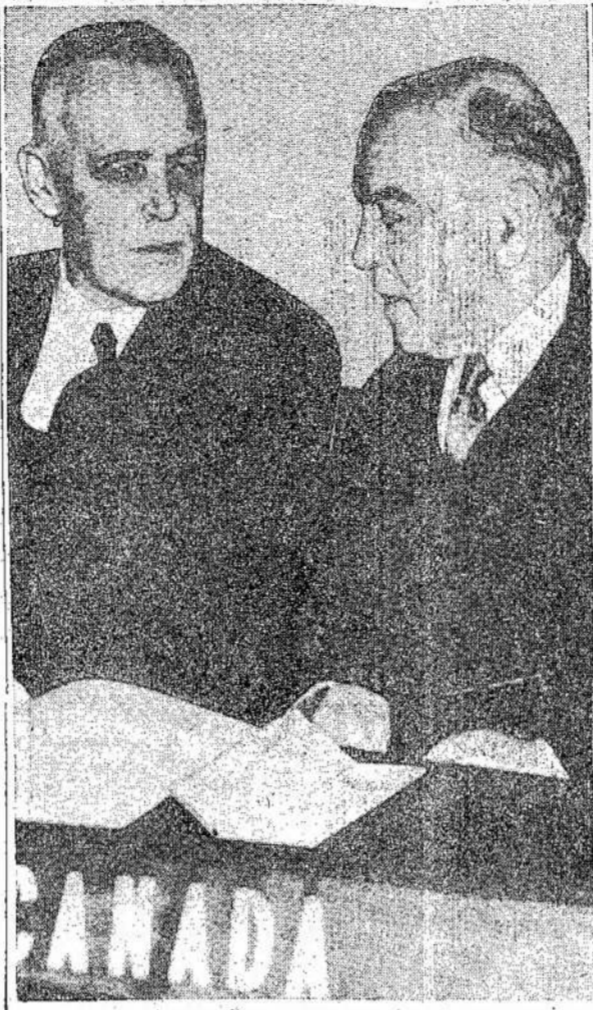
Hon. Louis St. Laurent ir premjeras King kalbasi Jungtinių Tautų susirinkime. St. Laurent yra vyriausias Kanados delegatas. St. Laurent dabar yra Kanados užsienio reikalų ministras. Ši ministerija įsteigta vasarą.