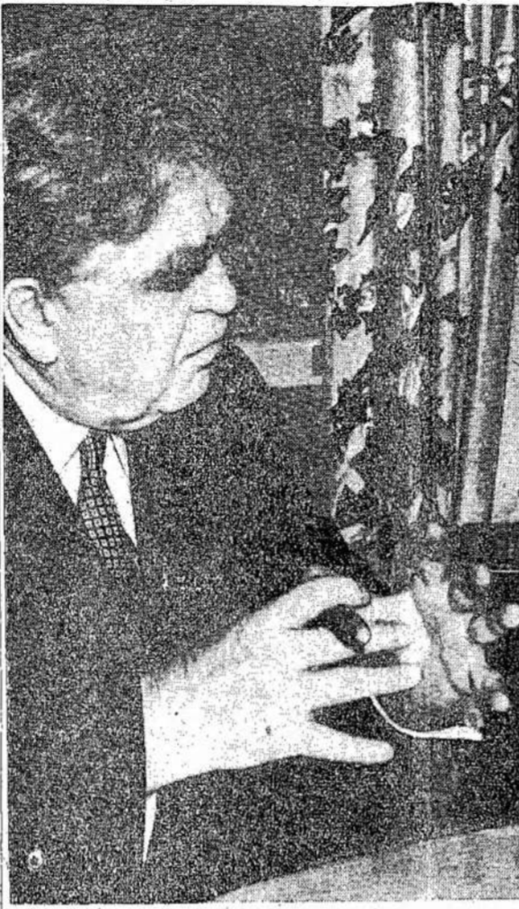
John L. Lewis, Jungtinių Valstijų mainierių unijos vadas, aiškina valdžios atstovui apie reikimą pakelti mainierių algas ir vėl, kadangi panaikinus kontrolę, viskas

Šioje programoje nėra nieko ypatingai naujo. Už šią programą kovojo iki šiol Italijos komunistai ir dalinai socialistai. Bet šis susivienijimo veikimo pasirašymas pridoda naują jėgą tai kovai. Tas susivienijimas nevien sudėda abi komunistų ir socialistų jėgas, bet jas keletoipai padidina. Tas susitarimas taipgi užkerta kelią dešiniųjų socialistų ir krikdemų koalicijai, kuri buvo bepradėjusi kurti. — Vilnis.