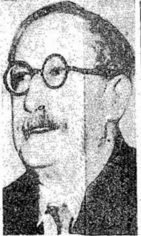
Leon Blum, 74 metų amžiaus Francijos socialistų vadas, kuris išrinktas laikinu Francijos premjeru. Kadangi nei komunistai, nei krikščionys nesudarė daugumos, tai susitarta rinkti socialistą, viudurio atstovą.