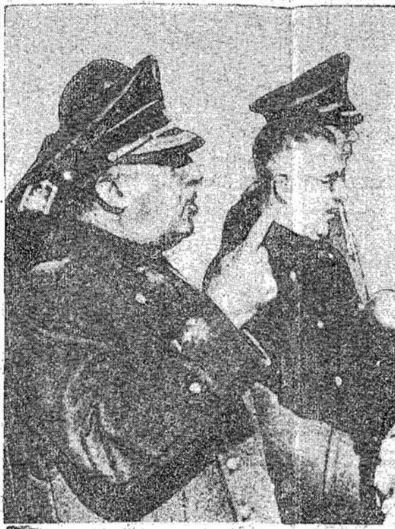
Generolas Francisco Francas, Ispanijos diktatorius, nepatenkintas, kad Jungtinių Tautų asamblėjos nutarė atšaukti ambasadorius iš Ispanijos. Bet jis džiaugiasi, kad buvo atmetas SSRS pasiūlymas skelbti ekonomines sankcijas. Čia jis matomas kalbant j kareivius.

Tokiai spaudai, kuri netarnauja kapitalizmui, sunku verstis. Ji negali tikėtis brangių apmokamų skelbimų, kurie yra visų laikraščių gyvybės šaltinis. Amerikoje tūlas milijonierius bandė leisti laikraštį be skelbimų, bet nepajėgė. Jis dabar jau dės skelbimus. Tikrai klausimas; kiek