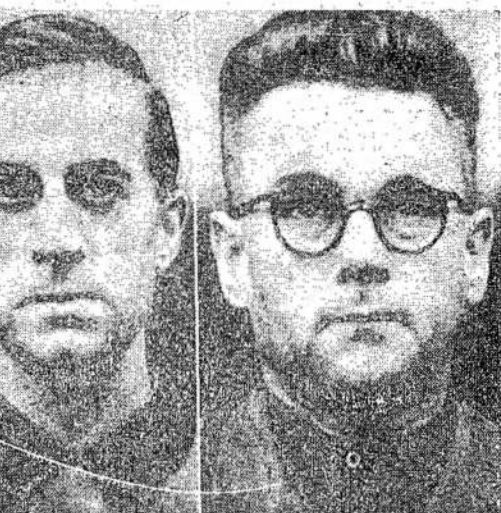
Dr. Karl Brandt, asmeninis Hitlerio gydytojas, ir Dr. Karl Gebhard, asmeninis Himlerio gydytojas, kurie kartu su visa eile kitų Vokietijos gydytojų traukiami teisman už "moksliską" nužudymą žmonių kempėse.

Profesoriskai Draugas: — Profesor, girdėjau, kad tavo žmona apdovanojo tave dvynukais. Mergaitės, ar berniukai? Profesorius: — Aš manau, kad viena mergaitė, o kitas berniukas, bet gali būti ir atbulai.