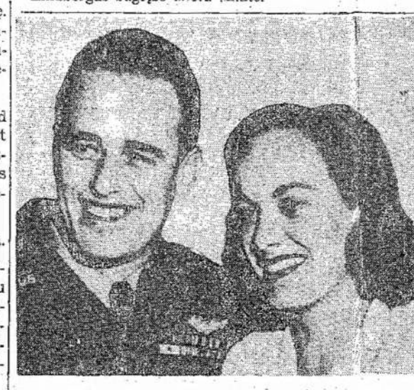
Elliott Roosevelt su savo žmona. Jie lankėsi Sovietų Sąjungoje ir dabar kelyje į namus. Jis žada rašyti straipsnius ir užtakuoti re-

Po to atėjo karas ir Vokietijos apgavimas užpuolimas. Paskui įtempta pauza ir laukimas susmukimo. Praėjo savaitės, o Rusija nesumuko. Traukėsi? Taip, bet didvyriškai ir sugabiai.