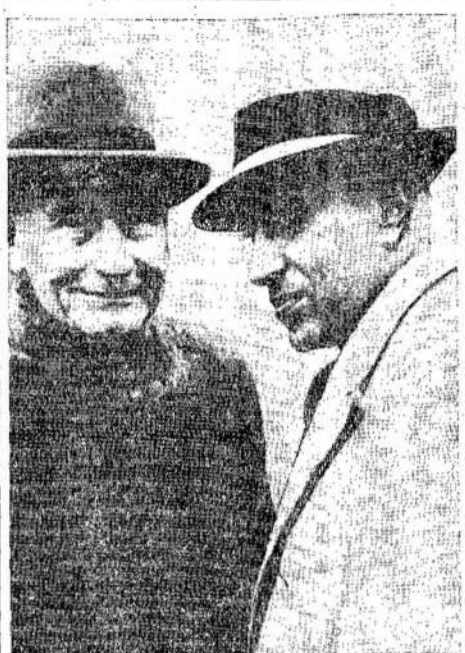
Lordas Pethie-Lawrence ir Pandit Nehru diskusuoja Indijos problemas. Indijos vidujiniai nesutikimai silpnina jos progas gauti nepriklausomybę. Daug kas iš Indijos veikėjų sako, kad Britantijos reakcionieriai atsakomybę už nesutikimą tarp Indijos gyventojų.

OTTAWA. — Aukščiausios teisimas atmetė parlamento nario Fred Rose apeliaciją, bet Fred Rose pareiškė, kad jis yra nekaltas. Jis nepadaręs jokio nusizengimo prieš Kanados žmonių interesus. Reporteriai per savo žoną pareiškė, kad jis taipgi nemano rezignuoti iš parlamento narystės. Nežinia, ką darys parlamentas, ar jis mes jį iš savo narių tarpo, ar ne.