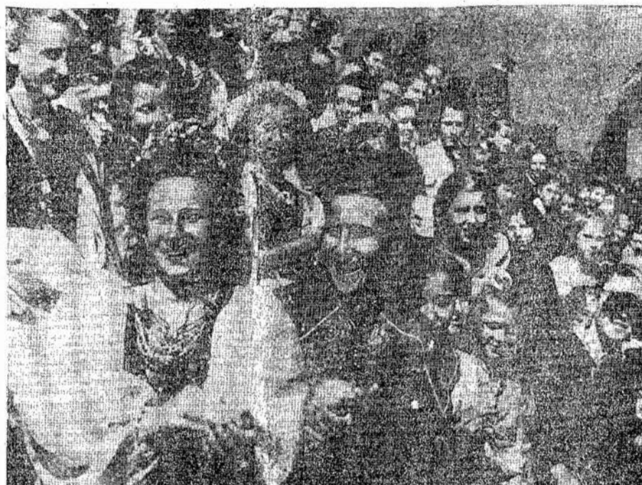
Atidarant Mokslo Sezo ną Vilniuje: mokinės tautiniuose drabužiuose dalyvauja