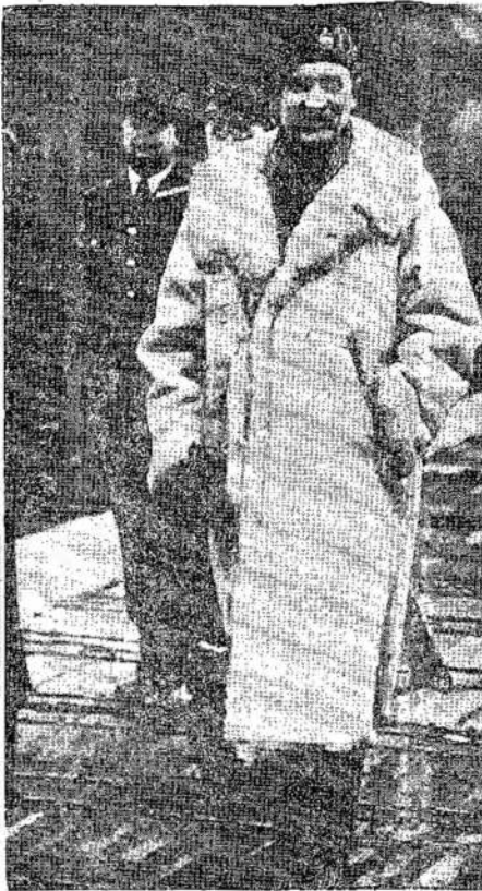
Feldmaršalas Lord Montgomeris, britų kariuomenės vadas, kurs šiomis dienomis lankėsi Sovietų Sąjungoje.

Lietuvos TSR liaudies ūkinių atstatyti bei išvystyti penkmečio planas atskleidžia respublikai dvasinio ir materialinio sukleidimo prapjektivias. Lietuva vėl pradės žengti vaisingos socialistinės statybos keliu, statybos, kuri buvo pradėta prieš karą ir kuri buvo vokiškąją