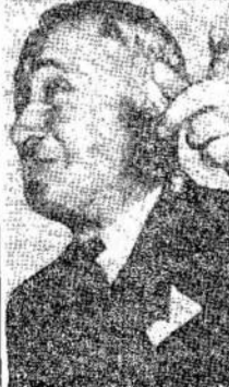
Emanuel Shinwell, Britanijos kuro ministeris, kurs šiuo laiku turėjo didelę bėdą, kadangi dėl stokos anglies turėjo uždaryti fabrikus ir elektros stotis. Arti 6,000,000 darbininkų buvo atleista laikinai.

Ji yra iš Ottavos, Kanados sostinės. Kanados premjeras Mr. King atsuntė pasveikinimą.