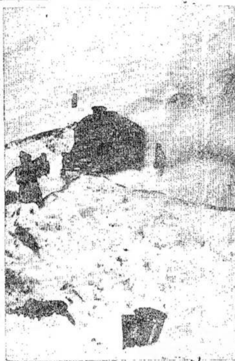
Ši scena tarp Manchesterio ir Buxtono, Anglijoje, duoda sukaityti. Šis traukinyss išstovėjo visą naktį. Anglijoje prastai sniego beveik nežino.

BELGRADAS. — Jugoslavų teismas nuteisė mirtin 8 nacių generolus už karinės kriminalystes.