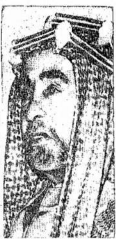
Arabų rataliai teigia, kad britai planuoja sudaryti Didžiąją Siriją ir pasodinti ant jos sosto Transjordanos karalių Abdūlą. Transjordanas būtų prijungtas prie Sirijos. Čia matote Abdulos, Transjordanos karaliaus, atvaizda.

Palestinoj Britanija negali nuraminti padėtis. Marshall išskris į Maskvos konferenciją kovo 5 ar 7.