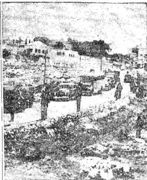
Militarinis britų automobilis sulaukęs eilę automobilių prie Jeruzalimo. Visi išvažiuojantieji iš Jeruzalimo automobiliai buvo krečiami, ieškant požeminio žydų judėjimo narių. Britai ketina įvesti karą stovį Palestinoj.

Išliko, kokią gi visuomenei nauda, jeigu poros, negalėdamos gyventi, negali persiskirti ir priverstos kentėti visą gyvenimą? Pavyzdžiui, vyras gali papildyti svetimoterystę šimta kartų, bet jeigu moteris neįrodo, tai ji negaus persikrų, kaip dabar įstatymai stovi. Ir taip dažnai būna.