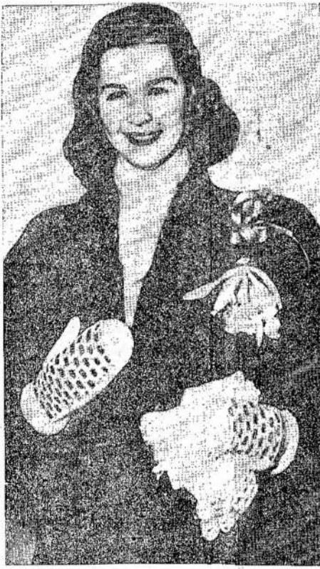
Barbara Ann Scott, ottawie- žime ant ledo Stokholme, tē, kuri aną dieną laimėjo Švedijoje. Rungtynėse dalyvavusi čempionatą čiuo- vavo 21 čiuožikas

O kada žmogus paslysta, sunku be pasikelti. Jis važiuoja tuo keliu, kuris veda prie reakcijos ir kovos prieš socializmą ir pažangą. Kaip Kaune jis tarnavo naciams, taip šiame kontinente jis tarnauja lietuviškiems reakcionieriams ir fašistams. Tokiu būdu, jeigu jis ir buvo kada geras liberalas, šiandien jau atsizadėjęs to liberalizmo. Jis vienąjį tempė su Lietuvos liaudies priešais.