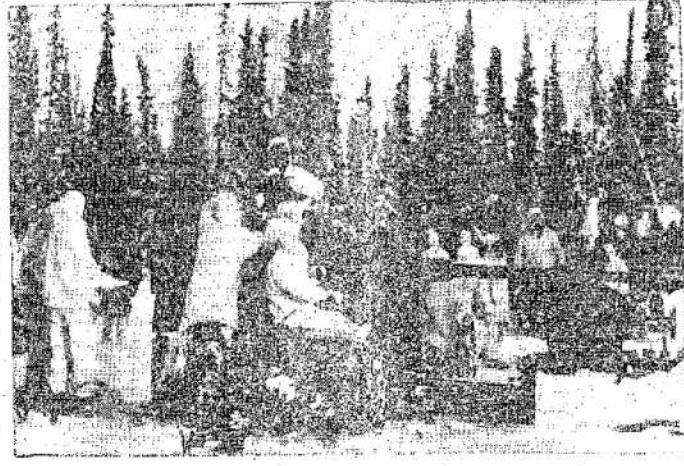
Jungtinių Valstijų ir Kanados Jungtinių Valstijų artilerija netoli Fairbanks, Aljaskoje, darant bandymus dideliuose šaltuose. Saskačevanos agrikultūros ministeris sako, kad Jungtinės Valstijos turi agresyvesnius planus ir traukia savo tinklą Kanadą.

Jau prasidėjo tretieji metai nuo Tarybų Lietuvos išsivaduoti iš vokiečių okupacijos. Praėjo gana daug laiko, galima buvo apgalvoti, apsvaistyti ir priėmti išvados. Ir vienintelė dora ir teisinga išvada yra pasiryžimas grįžti į gimtinę, pasiryžimas visas savo jėgas atiduoti Lietuvos gerovei. Šią galimybę tarybinė valdžia suteikia visiems, neprimindama daug ko iš praetis. Tuo jau įsitikino tūkstančiai ir dešimtys tūkstančių lietuvių, sugrįžusių iš tarybinės Vokietijos okupacijos zonos, kurie gali gyventi ir dirbti namie. Taip (Nukeita ant 6 pusl.)