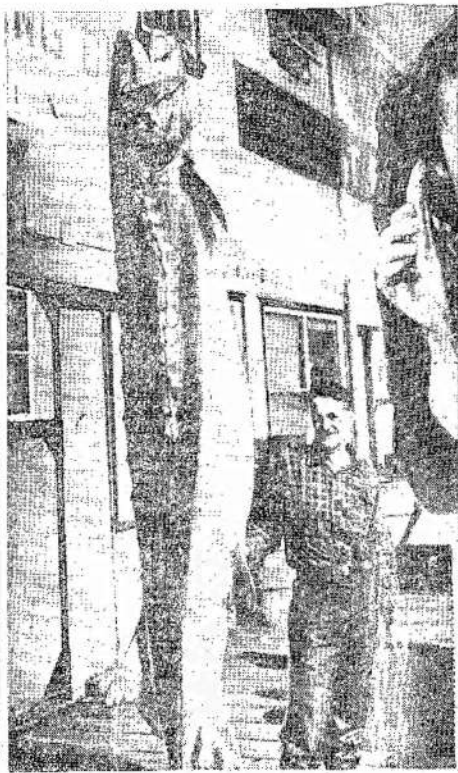
Tikėtai, ar ne, bet šis žuvininkas buvo tikrai laimingas. Šis sturgoonas sveria 500 svarų ir buvo parduotas už $200. Jis buvo sugautas netoli Haining, Britiškoje Kolumbijoje. Įvyko bėsis kova tarp žuvininko ir žuvies, tačiau žuvis buvo nugalėta. Žmogus mat turi frankius.

BERCZALE. — Ekstremistai bombardavo policijos stotį Saronoja; Tel Avivo priemiestyje. Manoma, kad keli policininkai buvo užmušti, nors jų lavonai dar neišimti iš griuvėsių.