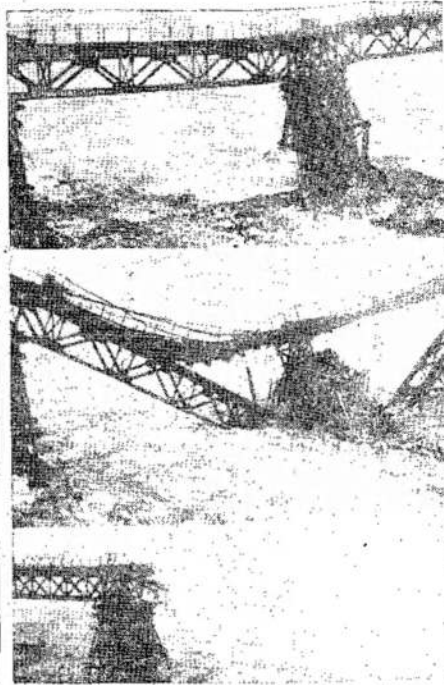
Potviniai labai daug žalos parodo tiltą prieš potvinių, o pridarė ir Lenkijoje. Čia matote tiltą Varšavoj vandens nūgriautą. Viršutinė scena.