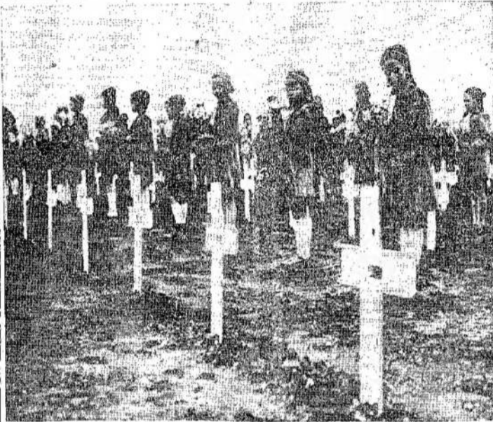
Olandijos vaikučiai ant kanadiečių kapų VE-Day minėjimo dieną. 2,500 kanadiečių guli Nijmegen kapinėse. Olandai atiduoda jiems pagarbą, nes jie padėjo išlaisvinti jų tėvynę. Kanadiečių kapų randasi daugelyje Europos vietų. 41,000 kanadiečių atidavė gyvybes, kad apginti pasaulį nuo fašizmo. Bet fašizmas vėl kyla.