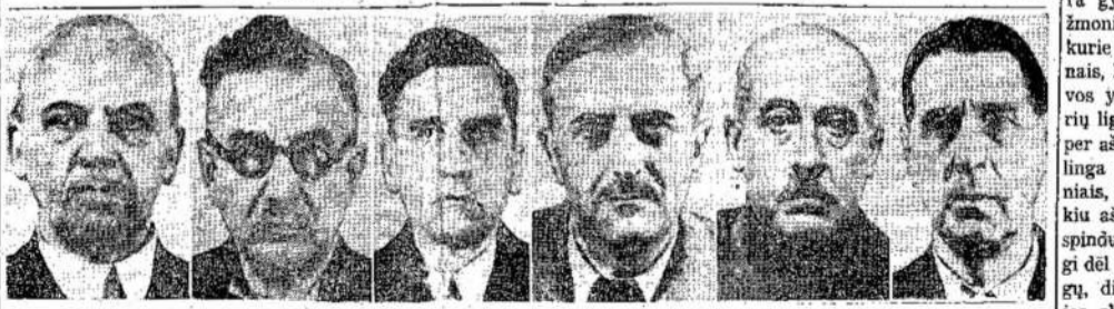
Vokietijos Farben Industriju viršininkai traukiami teis-man kaip kariški kriminalis-tai. Atvaizde matote 6 iš 24 apkaltintų. Jie ne tik finansavo karo, naudojosi tremtinius vergiškiems dar-bams ir kitais būdais plėšė tautas ir žmones. Jie yra patys didieji karo kriminalistai ir turį būti nubausti.

Tiesa, ne visi spinduliai yra gyduolės arba gergančių žmonių. Yra tokių spindulių, kurie labai turtingi mikronais, kaip tai raudonos spalvos yra geri gydymui įvairių ligų, bet dėl akių jie yra per aštrūs, todėl akys reikalinga apdengti mėlsvais akiniais, kad ne susidurtų su tokiu aštrumu. Infra-raudoni spinduliai taipgi yra naudingi dėl gydymo reumatikų ligų, diegių, šalčių, neuralgijos skausmų, ypatingai dėl tokių ligonių, kurie gyvena pajūriuose arba netoli vandens (Nukeltą ant 5 pusl.)