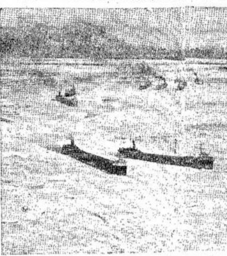
Gegužis šiomet atšiušymėje ne buvo įšalę laivai ir reikėjo savo gražumu, o šalėu. Pir- ledlaužio pajuosavimui. Lėnomis dienomis buvo tiek das Eric ežere siekė 20 myšalta, kad kai kurie ežerai lių nuo kranto. Vaizde matuožalo. Buffalo prieplaukoje te keletą laivų įšalusų.

Scenoje vėl pasirodė mišrus choras ir padainavo porą dainelių. Publika nenorė-