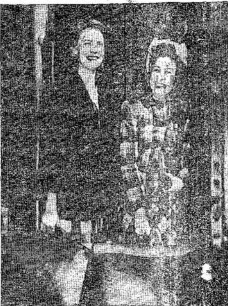
Apie 200 moterų delegacijų lankėsi Ottawoj su protestu prieš kainų kėlimą. Jos įteikė valdžiai reikalavimą, kad kainos būtų numuštos 10 nuosimčių. Čia matote dvi delegates iš Toronto delega-cijos iš 50 narių.

WASHINGTON. — Tho-mas-Rankin neamerikinis komitetas turįs sąrašą mil-jonų žmonių, nužirimų e-sant komunistais.