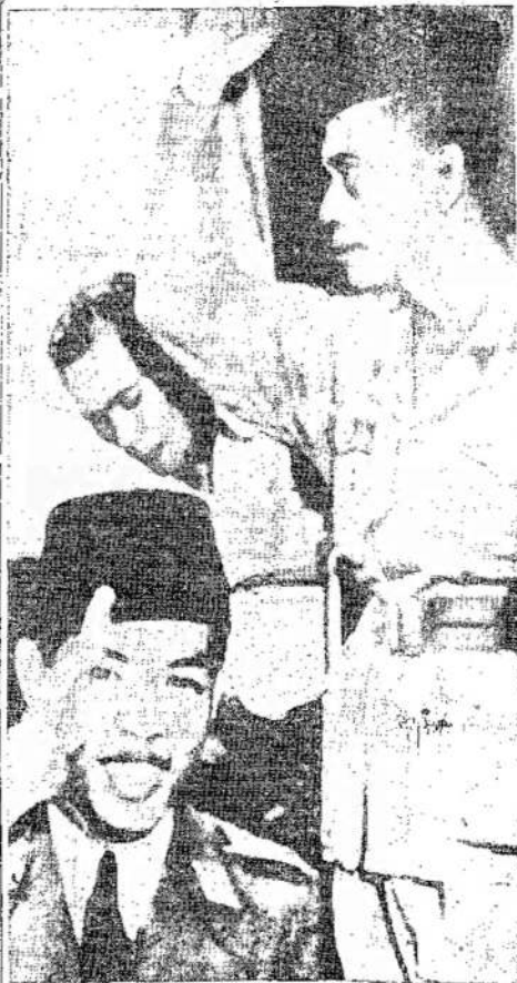
Leitenantas generolas Sudirman, 63,000,000 indonezų militarinis vadas. Indonezai

SOFIJA. — Bulgarijos vyriausybė pareiškė, kad Bulgarija padavė aplikaciją, prašančią ją priimti į Jungtines Tautas.