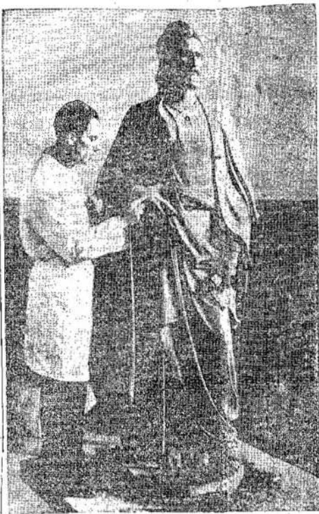
Atsižymėjęs Azerbaidžia nuo minklą odžianam Azerbaidžiano poetui Nizami. Pamincklas bus Bakų mieste.

Jdomu pažymėti tų, kad Čiangkaišeko armijos labai prastai kariaujančios. Geriausios armijos, apginkluotos amerikiečių ginklais ir amerikiečių lavintos, buvo lengvai sumuštos. Amerikiečių ginklai pateko komunistams.