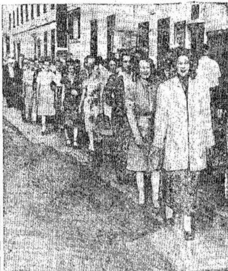
Eliniai unijistai suranda, nlijos. Cia matote CIO ir AFL unijistus Ottawoje ant piketo linijos.