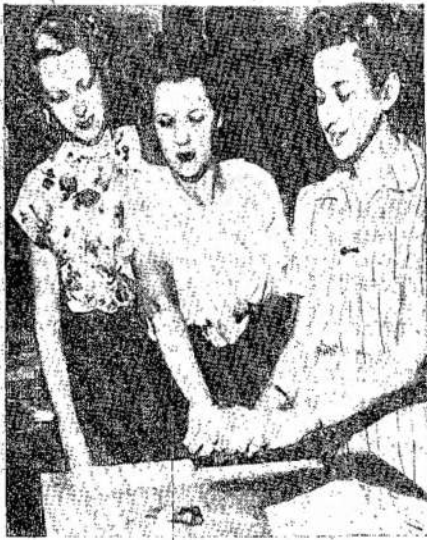
Visi Jungtinių Valstijų valdžios tarnautojai, pradėdami nuo paprastų raštininkų, bus ne tik nuodugniai klausinėjami, bet ir jų pirštų antspauds nuimamas. Nuotraukoje — imamos pirštų nuotraukos.

vyzdžiui, gali būti dideli ar maži gyvūnai, visai kitokių formų. Dabar apie sąlygas planetose. Kiek mokslas yra patyręs, planetos nėra tinkamos gyvybei. Vienos per karštos, kitos per šaltos. Marsas skaitomas palankiausias gyvybei, nors toli gražu nėra toks prielankus, kaip mūsų žemė. Tenai gali būti gyvybė. Mūsų planetos palydovas Mėnulis yra arčiausiai nuo mūsų ir būtų tikrai įdomus dalykas, jeigu jis turėtų gyvybę. Bet jis nelaimingas tame, jis neturi oro. Vienas šonas šaltas, o kitas labai šiltas. Toks keitimas temperatūros — visai netinkamas gyvybei. Jeigu mėnulis turėtų gyvybę, ypatingai jeigu tenai būtų tokių gudrių žmonių, kaip kad mūsų žemėje turi, tai šiandien būtų galima bandyti susikalbėti. Radaro bangos pasiekia mėnulį labai lengvai. Radaro pagalba galima nutraukti mėnulio fotografiją. Kitos saulės velkiausios turi tokių planetų, kaip kad mūsų žemė, ir tenai gyvybė yra. Bet tas nebus žmogui žinoma. Nors žmogus turi gerus įrankius ir gali toli matyti, tačiau to neužtenka. Teleskopai niekad nepasiekia taip toli, kaip jo protas pasiekia, bet žmogus protas negali matyti, kas tenai yra. Jeigu žmogus ir labai toli nužengs savo mokslu, toliausiai jis galės pasiekti, tai