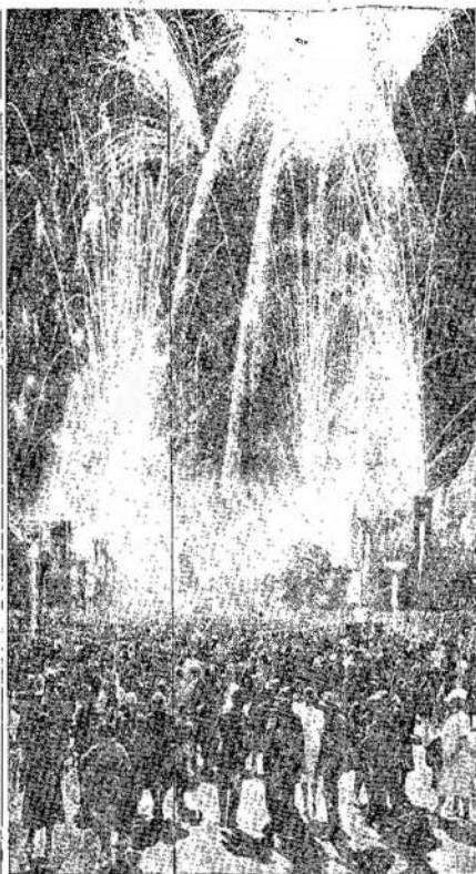
Kiekvieną vakarą, prieš uždarant Kanados Nacionalę Parodą Toronte, būna raketų šaudymas. Šioje nuotraukoje parodoma dalis tos demonstracijos.