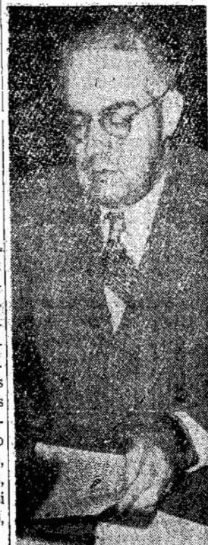
Dr. Oscar Langė, Lenkijos Atstovas, kurs pastebėjo, kad Jungtinės Valstijos atsakomąsias už neramumus Graikijoje. Amerikiečiai esą tiesiog diktatoriai Graikijoje.

Ukmergė. Keramikos įmonėje mechanizuojamas darbo procesas. Praplėstame keramikos ceche įrengti 3 nauji presai, praplėstos džiovyklos.