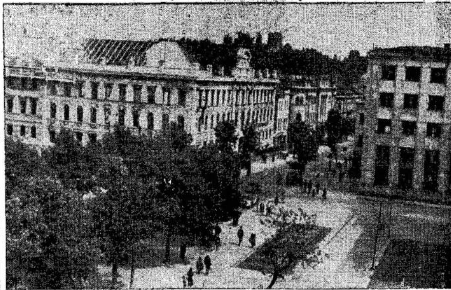
Centrinė Vilniaus gatvė — Gedimino gatvė.