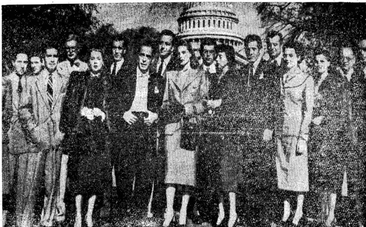
Dvidešimt šeši Hollywoodo artistai, kurie atskrido į Washingtoną protestuoti prieš Neamerikinio Komiteto atakas ant Hollywoodo artistų, rašytojų ir filmų gamintojų. Jų tarpe jūs rasite Lauren Becall, Paul Henreid, veidus Homphrey Bogarto, Danny Kaey, Jane Wyatt, Richardo Conte, June Havoc, Larry Adler ir kitų.

Išgydyti migrėną nelengva. Reikia surasti jos tikrąją priežastį ir paskui jos vengti, saugotis. Galvoskaudis galima palengvinti, vartojant nuolatai daugmeningus vitaminus — ir dar dadėkui pieno kalkių (calcium lactate 10 grains) po 6 arba bent po 3 tabletes kas dieną. Taipgi nikotinės rūkšties (nicotin acid, 100 miligrams) po 6