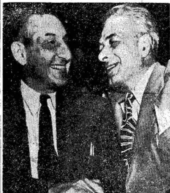
Filmų rašytjas John Howard Lawson (kairėj) kalbasi su filmų gamintoju Irving Pichel po to, kai Lawson buvo nustumtas nuo liudininkų platformos už atsisakymą pasakyti Neamerikiniam Komitetui, ar jis yra komunistas, ar ne. Kiek anksčiau keli kiti jūdžių artistai buvo panašiai apkaltinti paniekiniame komiteto.

Brazilijos Lietuvių Demokratų Spaudos Komisija.