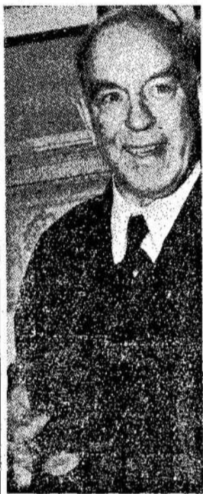
Kanados premjeras Right Honorable W. L. Mackenzie King rodo meilę, kurį jam įteikė kanadiečių klubas New Yorke. Jis užsuko tenai vykdamas į Angliją, į karalaitės vestuves.