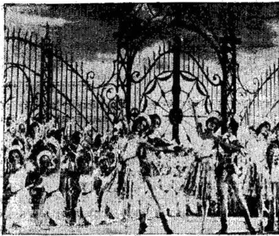
Scena iš "Rusų Balerinos", kuri rodoma Kino teatre, Toronte. New Yorke ši filma buvo rodoma tris mėnesius. Laikraščiai atsiliespė labai prielankiai.

Vajininkų ir Rėmėjų Doroel šiuomi atkartotinai primename, kad visi Liaudies Balso jubiliejinio vajeaus darbo