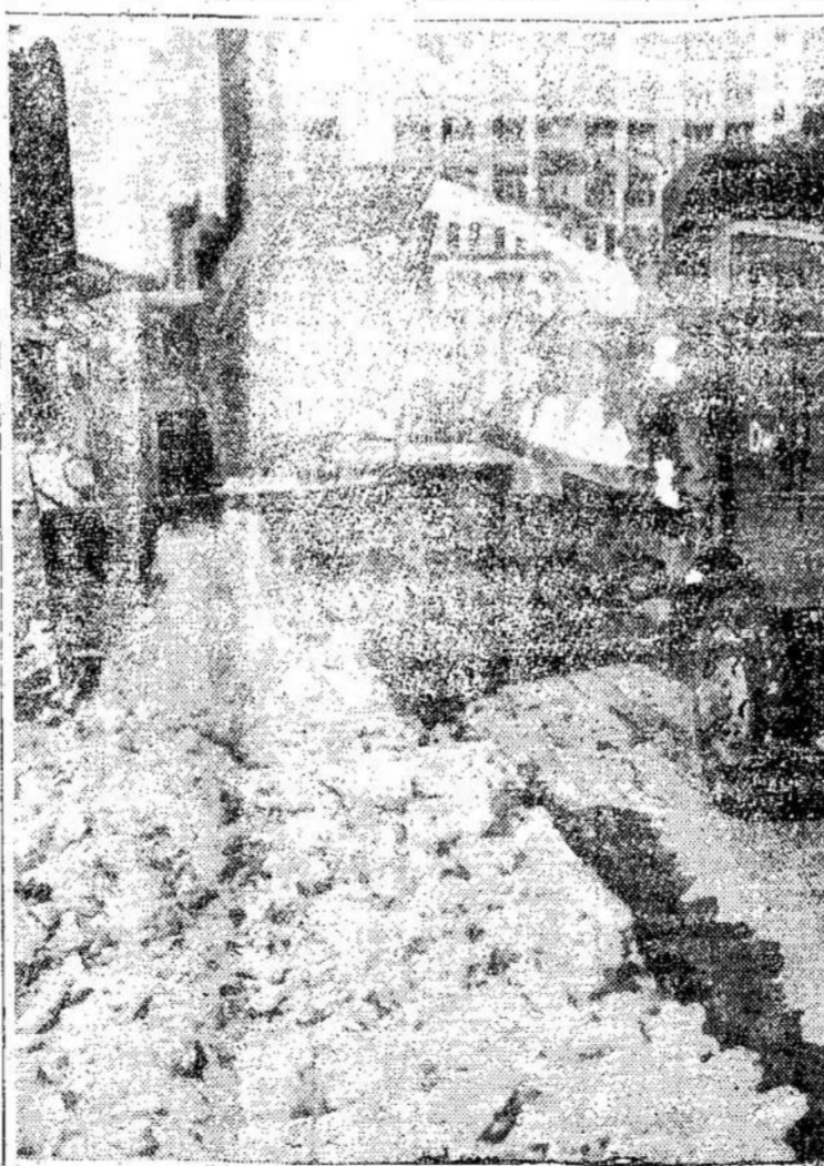
Montrealo miesto paskolinta toks didelis kiekis sniego, kad prisiejo kreiptis kitur pagalbos.