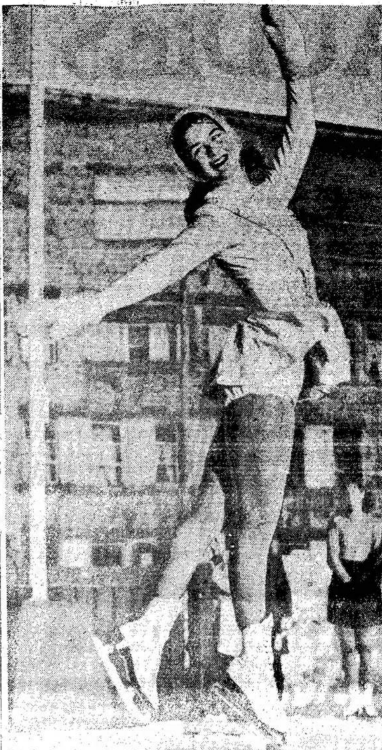
Barbara Ann Scott, Kanados mūšėja, per metais ji tapo didžiausia čiuožikė, renkama Europos čempionai. Čiuožijadai vasario mėnesį.