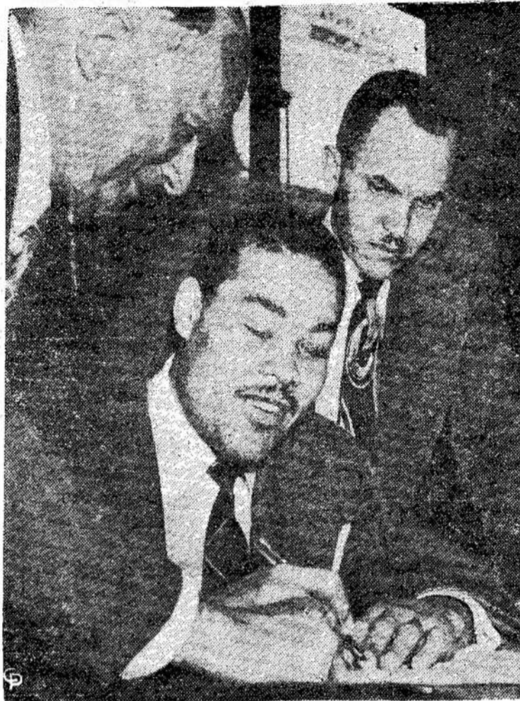
Joe Louis, pasaulinis kumštinių kumštinių čempionas, pasirašo kontraktą naujoms kumštynėms. Jis sako, kad jis pasirengęs apginti save nuo biltininko ir išlaikyti čempionatą. Ta, žinoma, parodys ateitis.