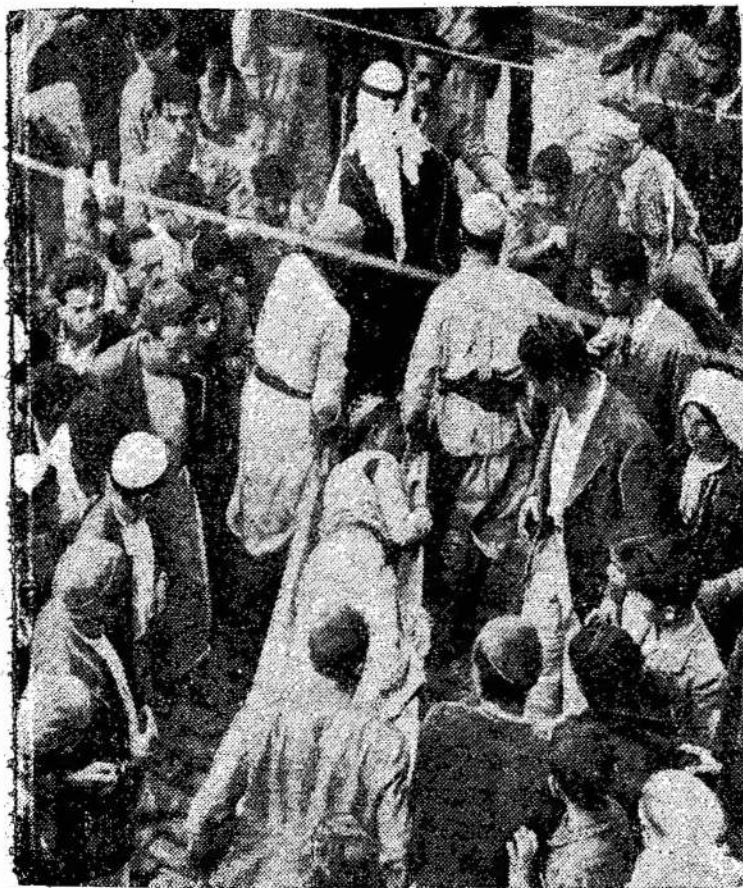
Žydų ir arabų susikirtimai laiko buvo užmušta 800 as-Palestinoje nesiliauja. Nuo lapkričio 29 dienos iki šio