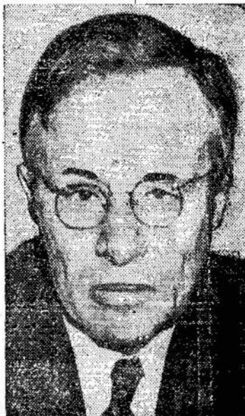
Rt. Hon. James G. Gardiner, agrikultūros ministras, kurs taipgi nori būti Kanados liberalų vadu. Liberalų konvencija įvyks kada nors vasarą.