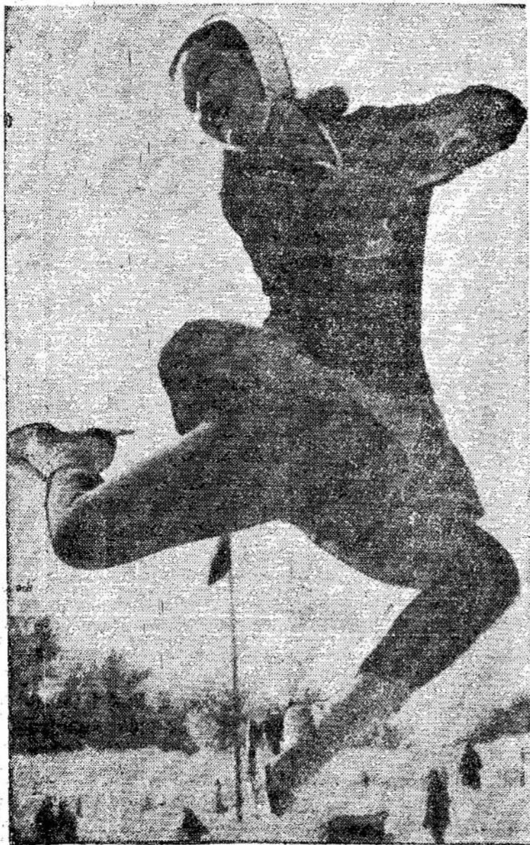
Garsioji Kanados čiuožikė ledo St. Moritz'e, Šveicarijoje Barbara Ann Scott, pasaulinėje, norėdama laimėti Olympinė čiuožimo čempionė, čia pijašados rungtynes. Ji jas laimatomata darant figūras ant mėjo.

Kanadai Reikia Jungtinių Valstijų Dolerių