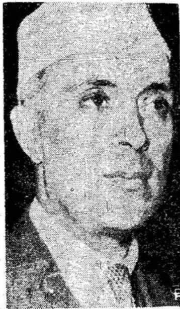
Hindustano premjeras Pandit Jawahar Lal Nehru, kurį politiniai piktadariai esą numatė nužudymui, kaip ir Gandį.

Iš tos sumos Kanada eksportavo už $2,811,800,000.