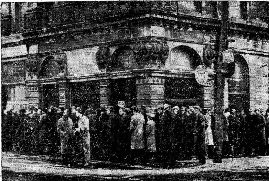
Šis paveikslas buvo nutrauktas ne 1930 metais, o 1948 metais, vasario mėnesį. Tai dalis 500 bedarbių, kuriems Jis pažadėjo duoti po vieną vieną Toronto turčius duotą tikieta kiekvienam kasdieną iki kovo pabaigos.

Dar nežinia, kaip šis kainų puolimas vystysis. Gal jis tiktai trumpalaikis. O gal ženklas artėjimo didesnių į-