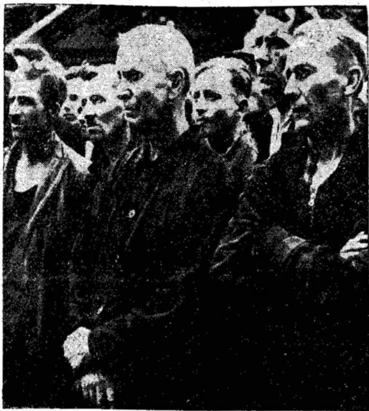
Grupė čekoslovakų plieno fabriko Kladno darbininkų, kurie aktyviai remia valdžios planus atstatyti kraštą per du metus be Maršalo plano pagalbos. Didžiuma šalies industrijos jau nacionalizuota.

Jis buvo didis darbuotojas už mainierių teises, ir visuomet buvo priešakyje bile judėjimo už geresnes sąlygas savo draugams darbininkams. Artritis paėmė jį į savo rankas pirma negu jis galėjo pasidžiaugti geresnėmis darbo sąlygomis, už kurias jis taip ilgai darbavosi, bet džiūgino jį tas, kad mai-