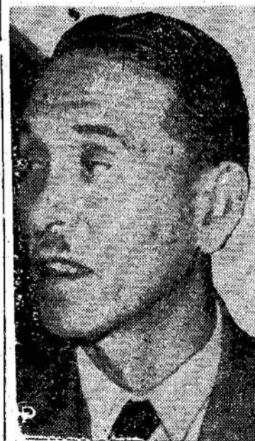
Japonijos naujas premjeras Hitoši Ašida, demokratas. Jį palaikė socialistai. Manoma, kad jis turės pasirinkti nemažai socialistų į savo kabinetą.

Ar neprisieis jai truputį ataušti kalėjime. Atrodo, kad naciškas karštis dar neišgaravęs.