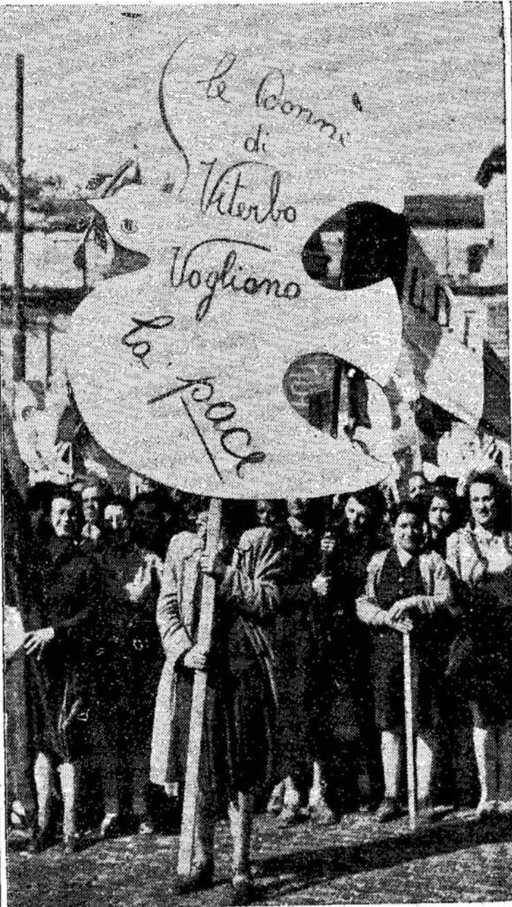
Italijos moterys demonstruoja reikalaujamos išlaikyti taiką. Jos kaltina, kad De Gaspari valdžios politika veda prie karo, kurią jos nenori.