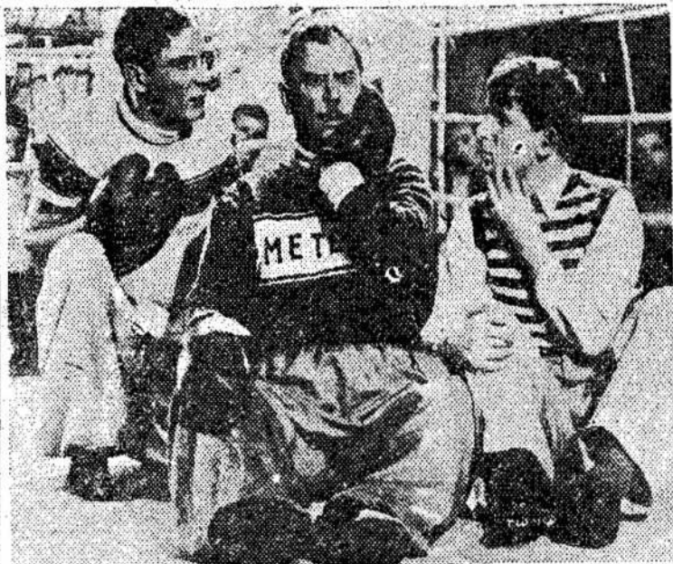
Scena iš vėliausios tarybinės muzikalės filmos "The Winner" (Laimėtojas), kuri rodoma Toronte Temple Theatre, 300 Bathurst St. Filma Kanadoj rodoma pirmu sykiu.

jos lietuvių klubo narių susirinkimas įvyks sekmadienį, balandžio 11, 2 valandą po pietų, Lietuvių svetainėje, 160 Claremont St.