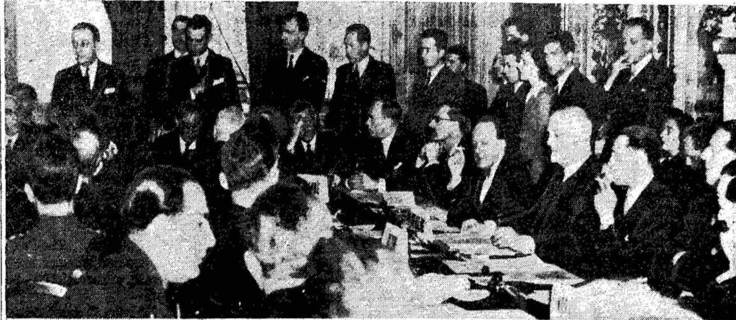
Atstovai 16 Europos valstybių, kurios sutiko pasiduoti Maršalo planui. Maršalo planą, kaip yra žinoma, turės tikslą neduoti įsigalėti liau- 16 valstybių bus prijungta ir vakarinė Vokietija.

Ta pačia proga prašome kuopas ir narius nepamiršti Centrą paremti finansiškai, paaukojant iš kuopų ir apskričių išdų, bei paskiriant