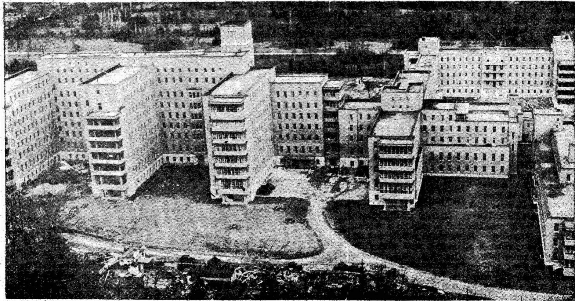
Dalis militarinės ligoninės — Sonnybrook, kuri pastatyta šiaurrytiniame Toronto pakraštyje. Joj telpa 1,450 ligonių. Galėtų sutalpinti, reikalaujant, iki 3,000. Skaitoma puikiausia ligoninė brįrandasi 650 veteranų. Jieta imperijoje. Šiuo metu joj

KANSAS CITY. — United Packinghouse Workers of America smerkia policijos brutalų užpuolimą ant streikierių šiame mieste, taipgi už išdužymą unijos buveinės.