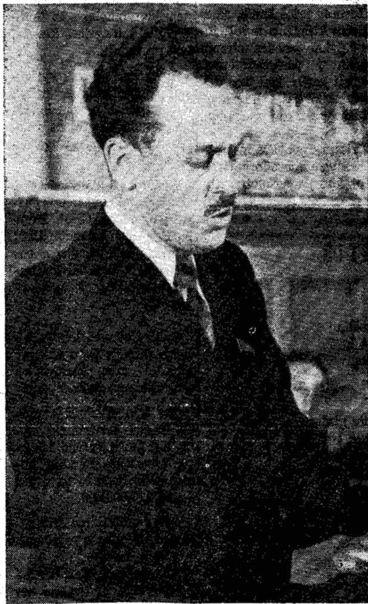
Poetas Tilvytis, kuris yra atsižymėjęs gražiais eilėrašiais ir kitais dailiosios literatūros kūriniais. Čia jis matomas skaitant savo poeziją Lietuvos Literatūros Dekadoj Maskvoje, kuri įvyko kiek laiko atgal.