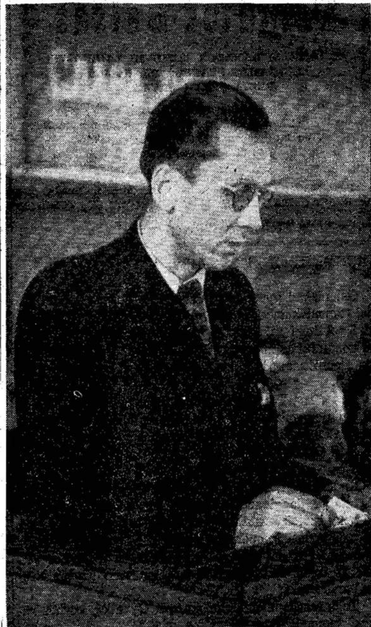
Poetas V. Sirijos-Gira, kurio eilėraščių matėt ir Liaudies Balse. Čia jis matomas skaitant savo eilėraščių "Teismas" laikė Lietuvių Literatūros Dekados Maskvoje.

Jis taipgi sako, kad Ontarijos rinkimų įstatymai yra labai nusėję ir reikalinga patobulinti.