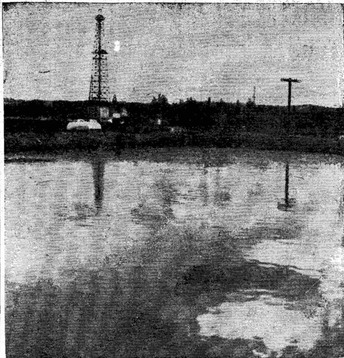
Aliejaus ežeras prie Atlantic No. 3 šulinio, netoli Edmontono. Jis apima virš 40 ak-

Poetas, paįsytotojas arba dramaturgas gauna už savo naują gražų kūrinių laureato vardą. Visi mes tuomi džiaugiamės. Širdingai jį sveiki-