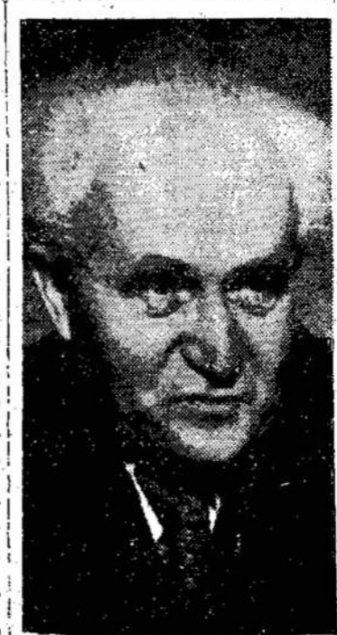
David Ben Gurion, Izraelio (žydų) valstybės premjeras.

24,000 žydų yra britų sulaukyti kempėse Cyprus sa-