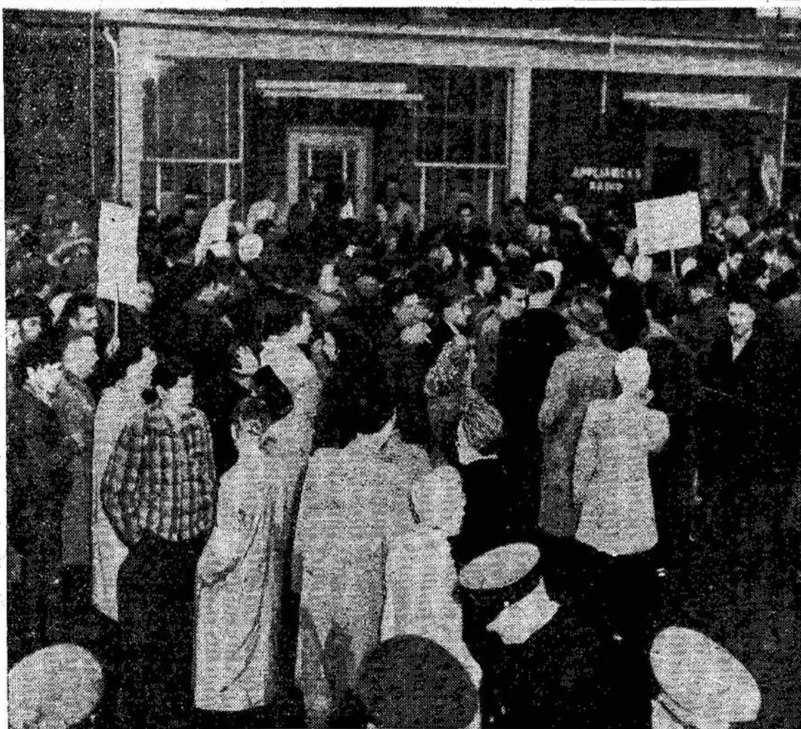
Rogers Majestic streikieriai suėmė jau virš 39 streikierių. Streiką sunkina tas faktas, kad atsirado kita unija, kuri bando paveržti vietą iš senos unijos.