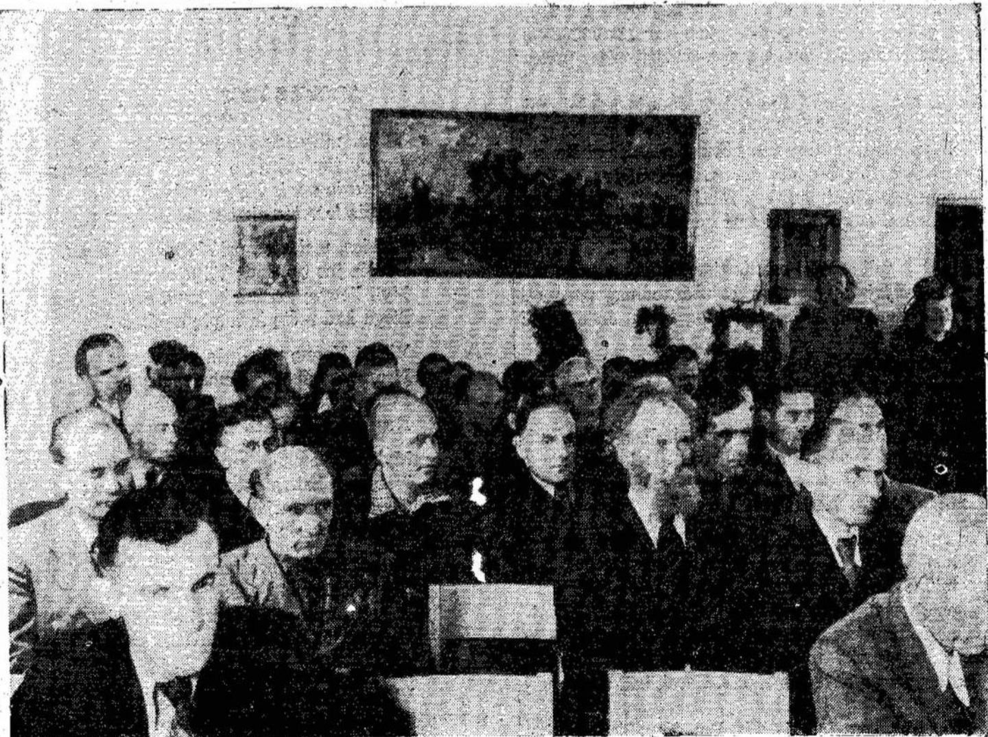
Lietuvos mokslininkai laike Mokslų akademijos posėdžio.

Per trumpą laiką atremontuoti rūmai Narbuto gatvėje, kuriuos Akademia gavo dar 1946 metais. Atremontuoti centriniai Mokslų Akademijos pastatai (Pabaiga ant 11 pusl.)