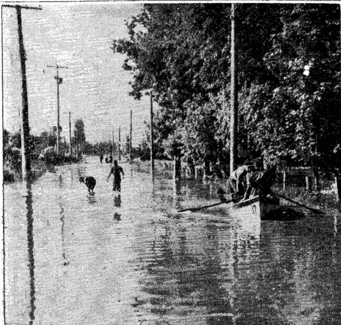
Scena Agassiz miestelyj Bri- tiš Kolumbijoj. Tokių scenų tūkstančiai Fraser upės slė- nyje. Tūkstančiai šeimynų li- ko be namų. Nuostolių pri- daryta jau už $30,000,000.