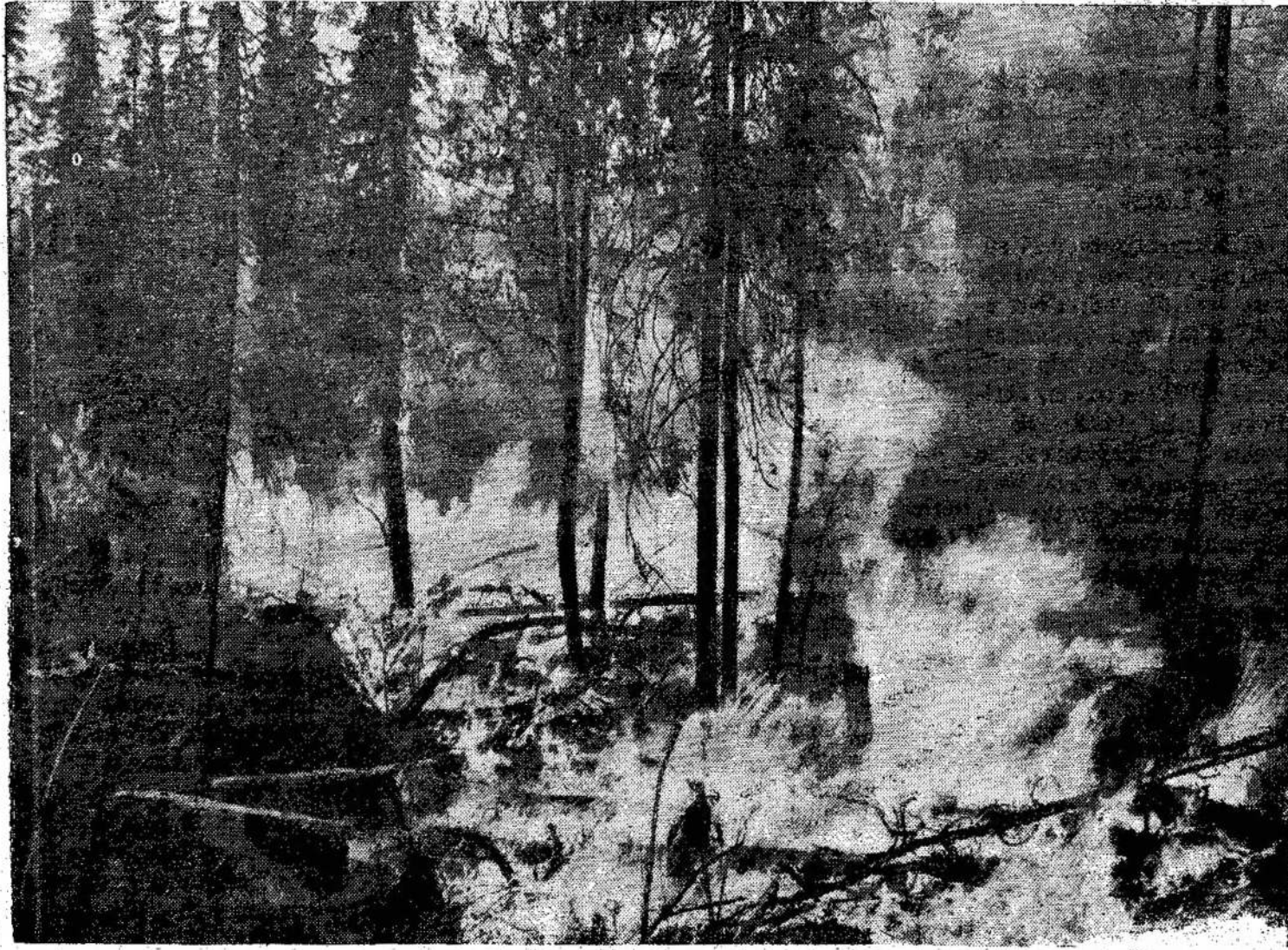
Dešimtys tūkstančių akrų miško šiaurinėj Ontarijoj išdegė tik šį pavasarį. Nėra būdo tuos gaisrus užgesinti. Tik didelis lietus gali padaryti jiems galą, bet labai re-

tai pasitaiko toks lietus gaisrų metu. Gaisrai kyla dažniausiai dėl neatsargumo tu,