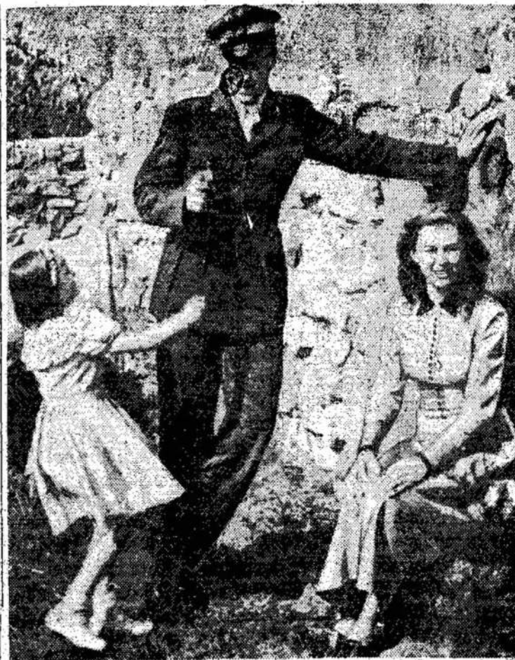
Caro Nikolajaus II sesuo didžioji kunigaikštė Olga Aleksandrovna ir jos vyras pulkininkas Nikolajus Aleksandrovičius Klikovskis su giminaitėmis.

Taigi, anglis turi didelę ateitį. Anglį galima paversti tiesiai aliejumi arba gesu. Reikia atminti faktą, kad