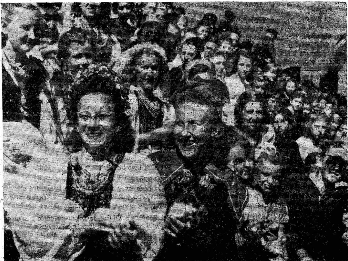
Šimtai tūkstančių Tarybų Lietuvos vaikučių ir studentų baigia mokyklos darbą ir rengiasi atostogoms. Daugelis iš jų praleis jas vasarvietėse, specialiai vaikams pastatytose.

Ne mažesne meile ir populiarumu naudojasi respublikos profesinių sąjungų sporto organizacijos. Pavyzdžiui, "Žalgirio" sporto organizacija šiuo metu turi 207 kolektyvus, 8 sporto klubus su 12,394 nariais. Šiaulių odos fabriko "Elnio" kolektyvas turi 136 narius, Kauno fabriko "Inkaro" — 110. Kauno akademinis sporto klubas — 1,600 narių. Prie šio klubo (Pabaiga ant 11 pusl.)