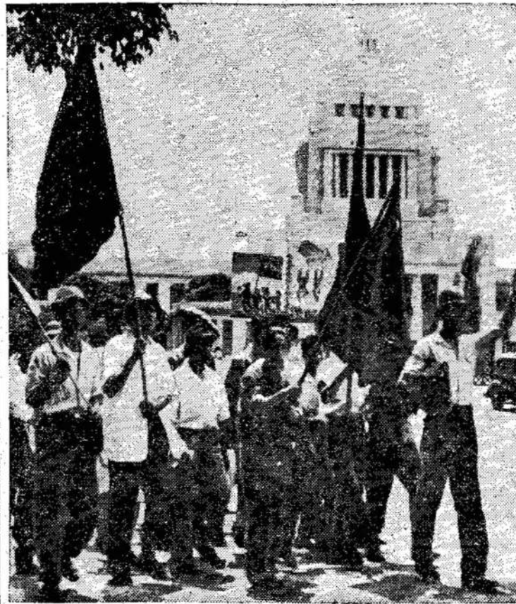
Japonijos studentai demonstruoja prieš aukštas kainas, truoja prie parlamento rūmų Tokijo mieste protestuodami prieš aukštas kainas, ypač ant maisto produktų. Visur žmonės kenčia

PARYŽIUS. — Sugriuvo Šumano valdžia, kada parlamentas išreiškė jam nepasitikėjimą. Parlamentas nukirto $40,000,000 nuo karių biudžeto.