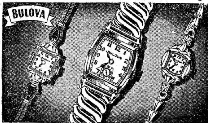
CATHERINE 17 jewels $3750