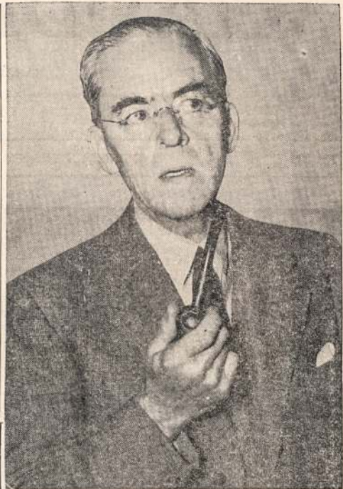
Stafford Cripps, Britanijos finansų ministras, kurs lankėsi Kanačioje. Iš jo kalbų

Kaip žinia, keturių didžiųjų susitarimu buvo įsteigta bendra Vokietijos kontrolė. Tos kontrolės buveinė buvo paskirta Berlynas, kaip vokiečių sostinė. Berlynas buvo padalintas į keturias dalis, kad kiekviena kontrolė dalyvaujanti valstybė galėtų turėti savo jėgas sostinėje.