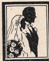
A. GARBENIS Fotografas

Telefonuokit Mums, Kada Norėsit Pasidėti Futras Vasarai