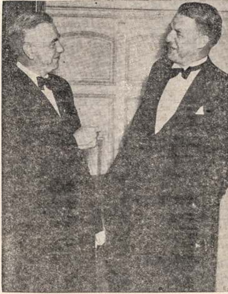
Abbott ir Costello. Netikit? Aišku, ne tie, kurie šopus krečia filmose ir ant radio. Tai Kanados finansų ministris Hon. Douglas Abbott ir Airijos premjeras John Costello. Pastarasis lankėsi Kanadoje ir tarėsi su valdžia.