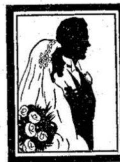
A. GARBENIS Fotografas

Telefonuokit Mums, Kada Norėsit Pasidėti Futras Vasarai