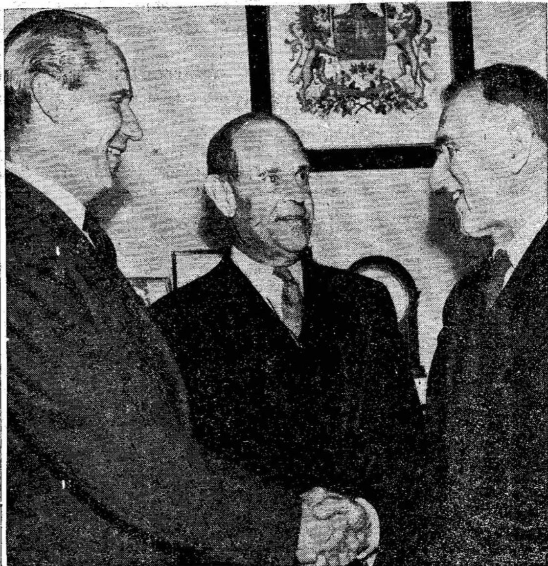
George Drew, nacionalis konservatų vadas, sveikina naują Ontarijos premjerą T. L. Kennedy. Viduryje stovi Ontarijos gubernatorius Hon. R. Lawson. Išrinkimas Drew nacionaliu vadu išgelbėjo jį iš nemalonios padėties. Jis buvo Ontarijos premjeras, bet neišrinktas į parlamentą. Būtų turėjęs turėti rinkimus vėl.

Liaudies armija artinasi prie Taiyuan, Šensi provincijos sostinės. Kita liaudies armija artėja prie Kweisui, Suiyano provincijos sostinės.