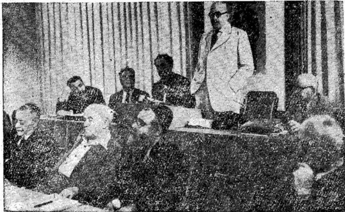
Izraelijos valdžia. Dr. Chaim Weizman, pagarsėjęs mokslininkas (stačias), buvo išrinktas pirmu Izraelijos prezidentu. Jungtinės Tautos vėlavė įsakymą žydams ir arabams sulaukyti mūšius, kurie išsiveržė net keliose vietose Palestinoj.