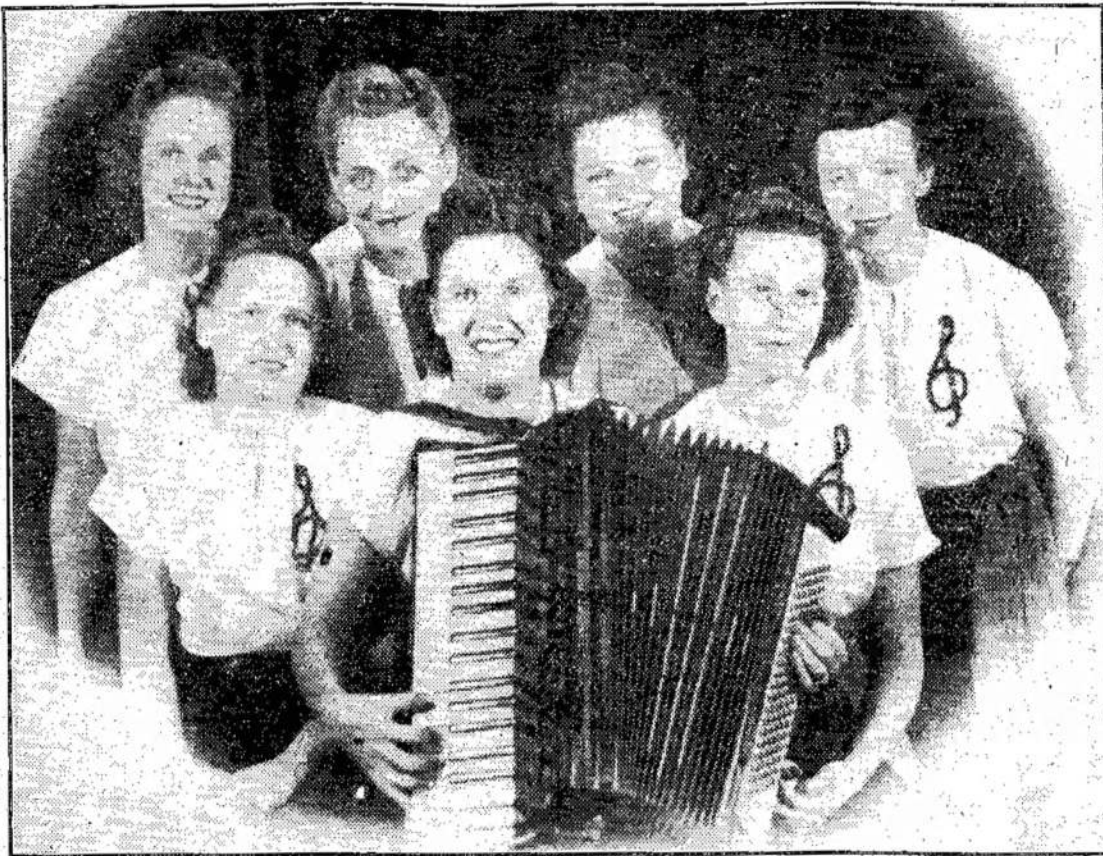
Garsusis Detroito siktetas, kuris dainuos Liaudies Balso metiniame koncerte, Toronte, lapkričio 27 d., Temple teatre, 300 Bathurst St.