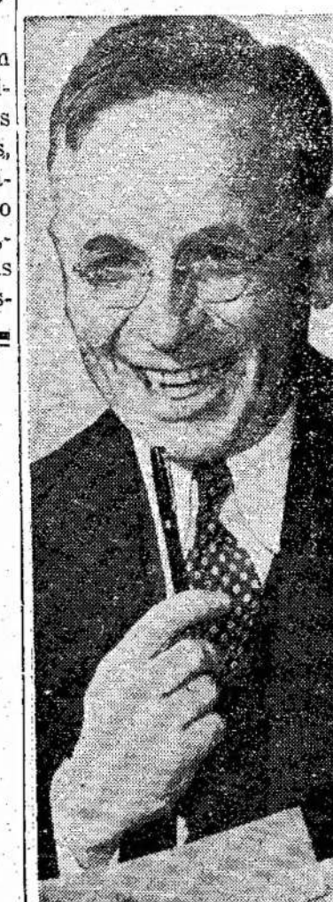
Stuart Garson, buvęs Manitobos premjeras, dabar naujas Kanados teisingumo ministras.

Sakoma, kad nacionalistai sudaro kariuomenę urmu suimdami kaimų jaunimą. Bet tas jaunimas neturi už ką kariauti. Feodalistai nenori pagerinti jų šeimų būvį.