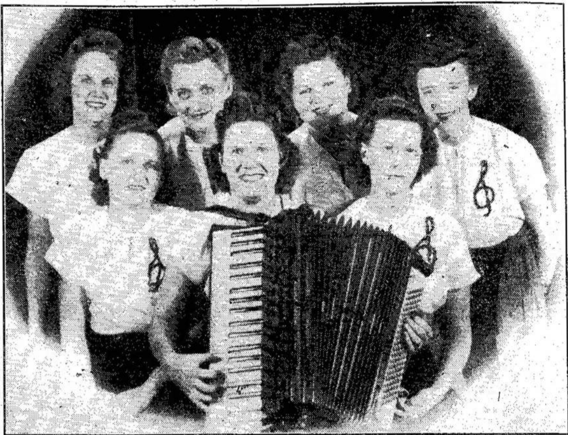
Garsusis Detroito siktetas, kuris dainuos Liaudies Balso metiniame koncerte, Toronte, lapkričio 27 d., Temple teatre, 300 Bathurst St.