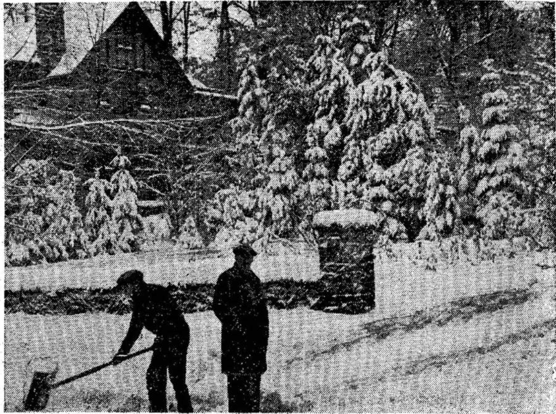
Ziemos grožis Ontarijos šiau rėje.

Liaudies Balso Redakcija ir Administracija