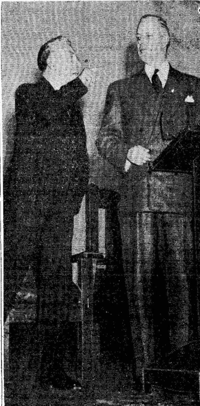
M. J. Caldwell, CCF lyderis, ir George Drew, konservatų lyderis, komunistų niekinimo čempionai, ant galo patys tarp savęs susirovė. Čia jie matomi arti peštynių rinki-