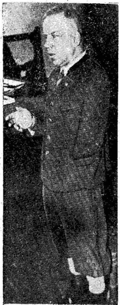
Max Amann, buvęs Fraanz-Eber knygų leidyklos direktorius, o vėliau SS obergruppen fiureris, stovi prieš denacifikacijos teismą Munchene. Jis atspausdino Hitlerio "Mein Kampf".

Jaunuoliai padarė labai gilių įspūdį mane. Jie turi savo sporto organizacijas ir imasi aktyvumo įvairiose srityse. Jie turi savo stiprią "bowling" lygą. Jie priklauso prie LDS. Turėjau progos susipažinti su daugeliu ir visi man labai patiko. Jie ne tik gabūs vienoj ar kitoj srityj, bet ir labai draugiški.