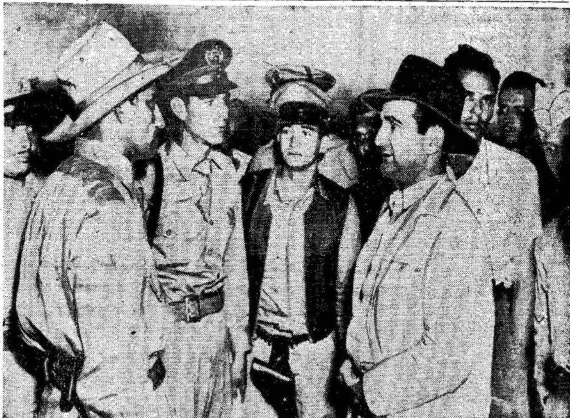
Costa Ricos prezidentas Jose Figures (dešinėje, su skrybėle) apklausinėja karininkus apie nicaragviečių invaziją.

Kongresinio komiteto investigatoriai sako, kad jis buvo įvardintas, kaip vienas iš tų, kurie 1938 m. išvėgė valstybės departamento dokumentus.