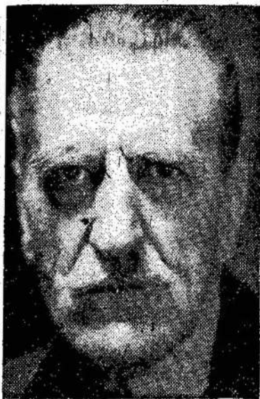
Sir C. Aubrey Smith, gabus Hollywoodo artistas, kurs šiomis dienomis mirė sulaukęs 85 metų amžiaus. Jis buvo kilęs iš Anglijos, kaip ir daugelis kitų Hollywoodo artistų.

Mes, repatriantai, džiaugiamės sugrįžę į motinos tėvynės prieglobstį ir galį, pagaliau, įsijungti į naujo gyvenimo statybą, galį atiduoti visas savo jėgas savo tautos, savo socialistinės tėvynės gerovei.