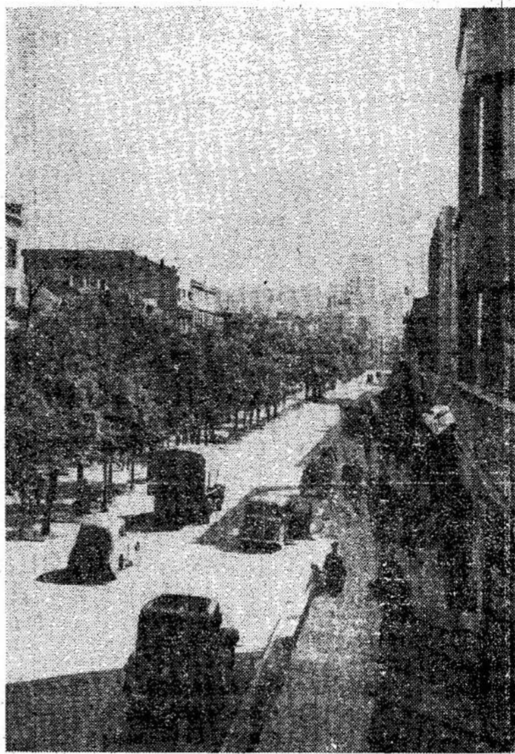
Laisvės Alėja, Kaune

Mes, Vilniaus Universiteto profesoriai ir moksliniai darbuotojai kreipdamiesi į Jus su šiuo atviru laišku, reika-