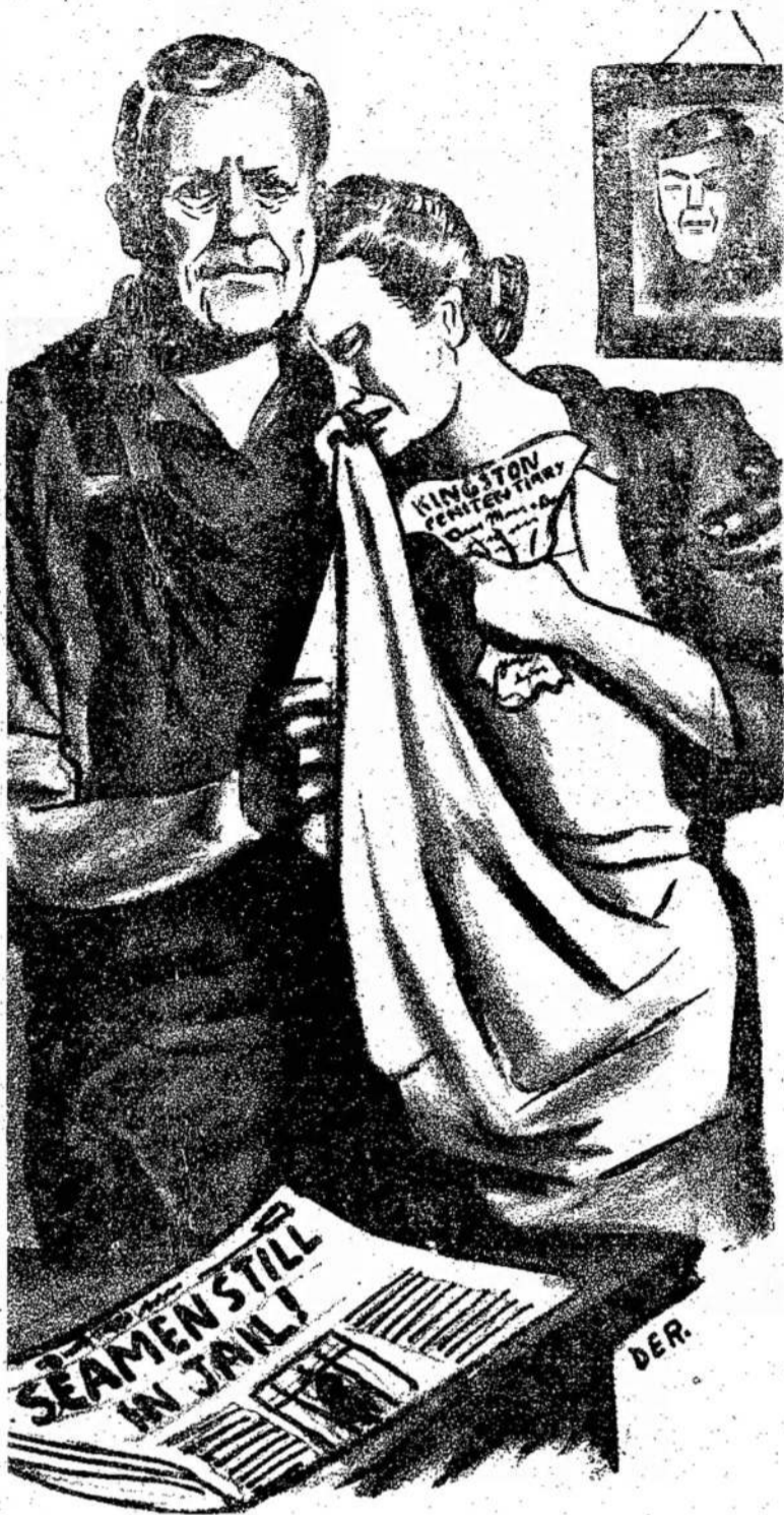
Jų vaikai kariavo už laisvę, bet ne visi laisvi.