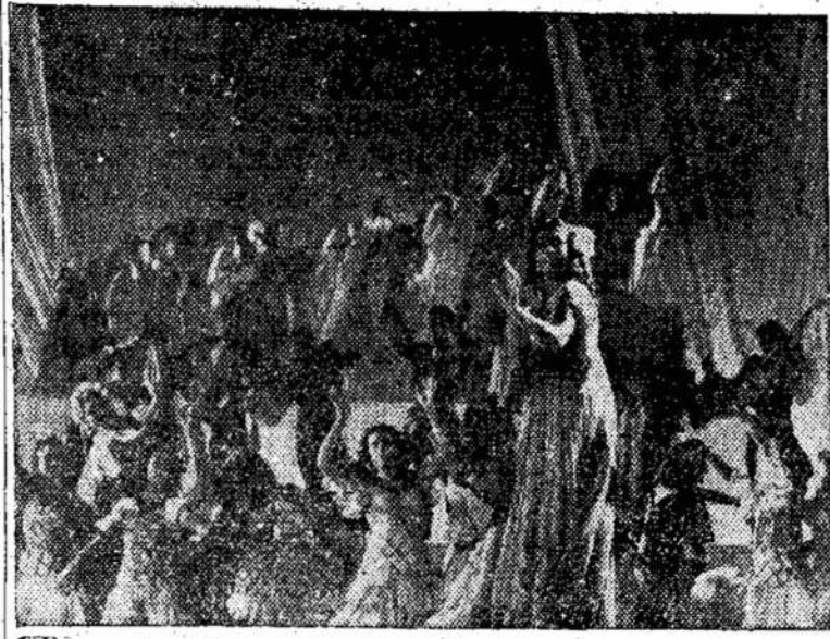
Maskvos Didžiojo Teatro baleto korpusas, kurs dalyvaus naujoj tarybinėj filmoj PAVASARIS (Spring), kuri bus rodoma King teatre, pradedant vasario 7. King teatras randasi Toronte, ant College ir Manning kampo.

Šiai draugijai priklauso visokių įsitikinimų ir tikėjimų