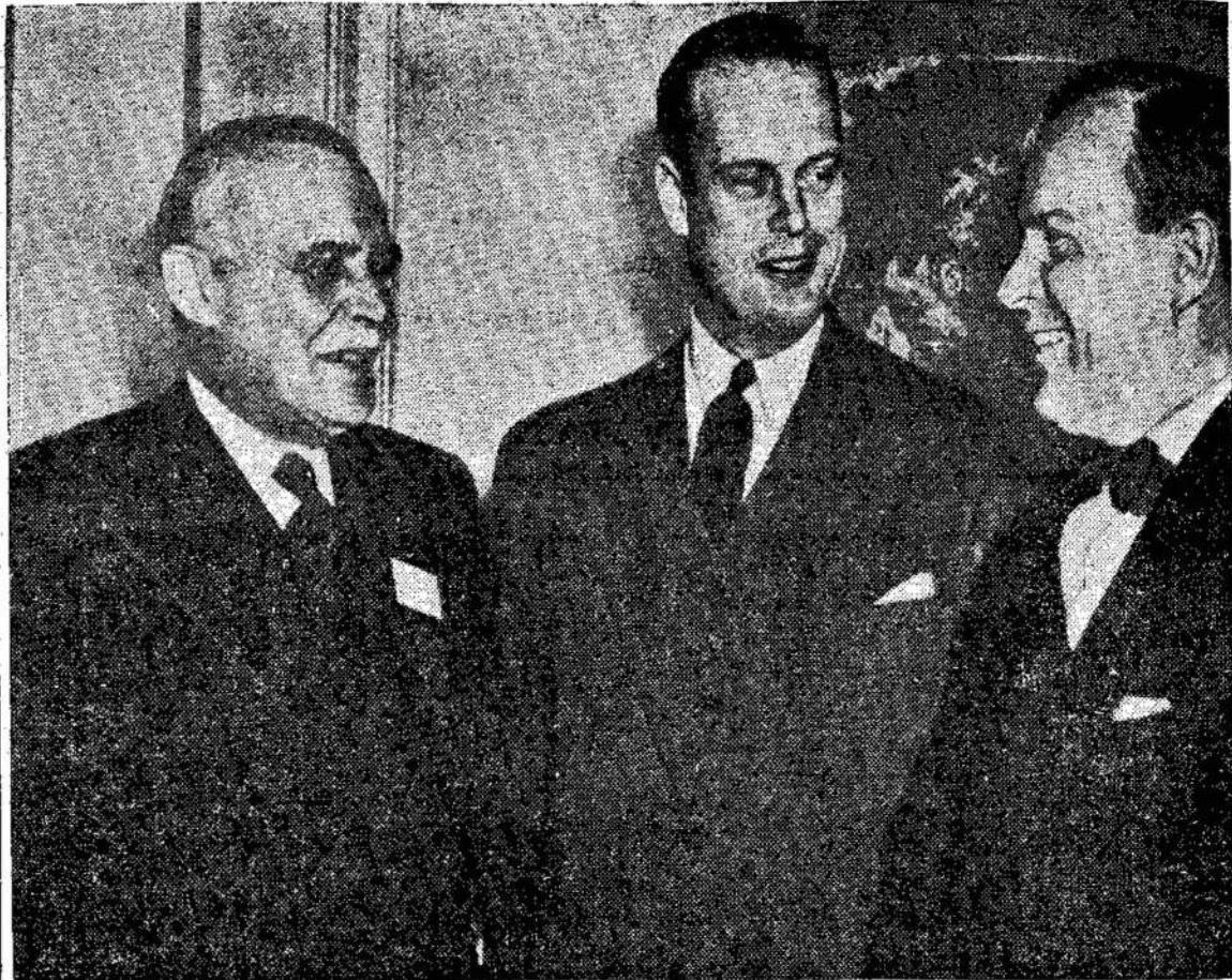
Premjeras St. Laurent, ministras R. H. Winters ir užsienio reikalų ministras B. Pearson prieš atidarant parlamento sesiją. Valdžia pranešė, kad šiais metais bus