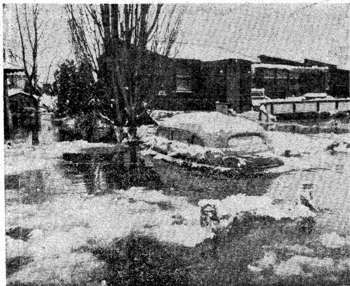
Montreale, Longueuil distrikte, pakilusį Švento Laury- no upė užliejo didelį distrik-

Deklaracijoje taip pat yra svarbių socialinių ekonomi- nių ir politinių uždavinių iš- vardijimas, ir jų įvykdymas užtikrins Lenkijos perėjimą į socializmą. Tai sparti ša- (Pabaiga ant 12 puslp.)